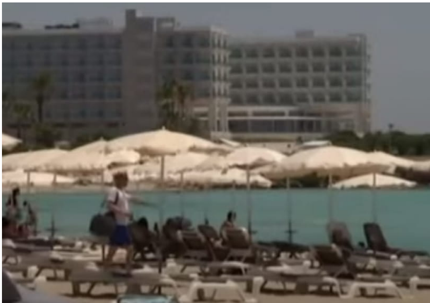
Кипр. 5 канал / Час. Підсумки тижня

"Существует опасность третьей волны пандемии, и некоторые страны ЕС ее уже переживают. Я надеюсь, что скоро мы откроем границы Европейского Союза для Украины, но надо ждать", – отметил министр иностранных дел Литвы Габриэлюс Ландсбергис.