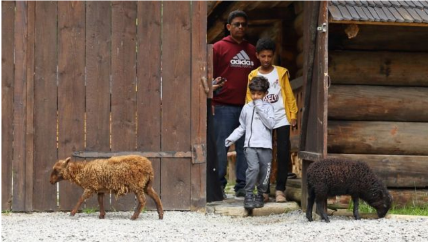
Арабские туристы часто покупают баранов в Карпатах.

"Это действительно туристический бум, и гостей из арабских стран в Украине сейчас больше, чем из других стран. В гостиницах они занимают до 50% номеров", - говорит Марьяна Олескив, председатель Государственного агентства развития туризма.