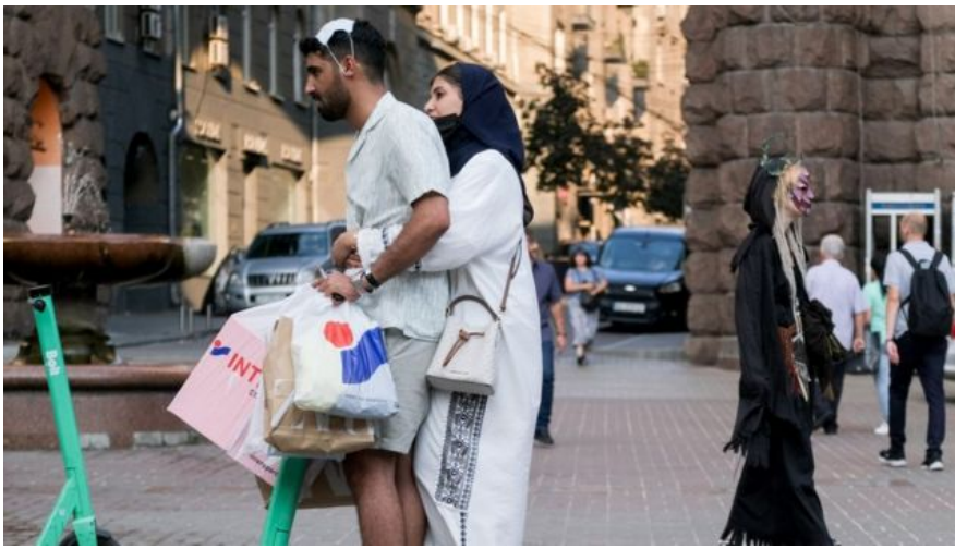
Туристы на улицах Киева.

Спросом пользуются большие номера с несколькими спальнями, есть специальные требования к ванной комнате - биде, гигиенические души. Обычно путешествуют семейными парами или большими семьями, часто ищут комфортного размещения по 5-6 человек в одном номере, рассказывает Кристина Кагуй из Reikartz Hotel Group.