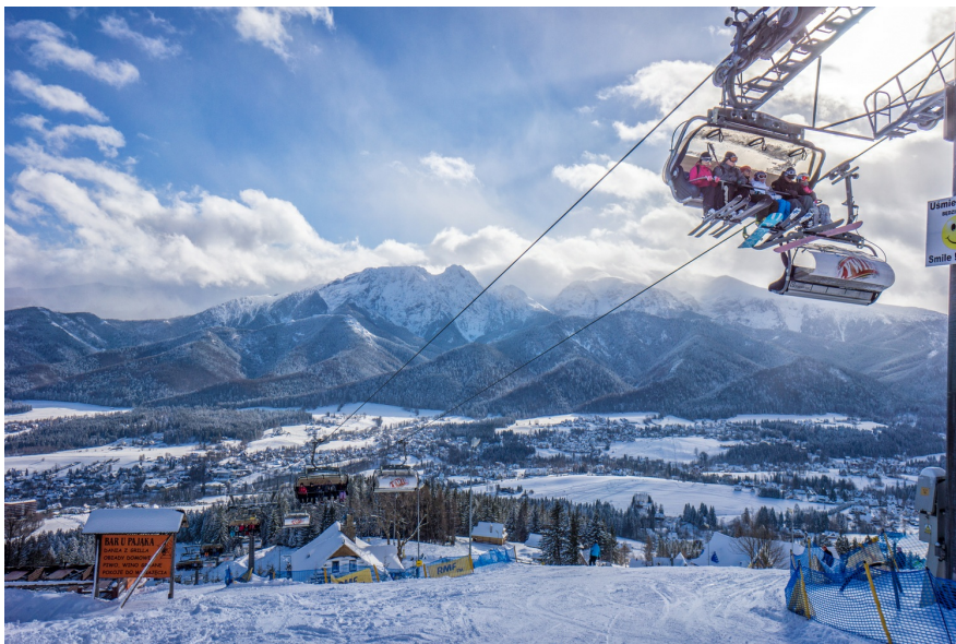
Современные подъемники и неповторимые виды

спорта, это закопанские склоны издавна облюбовали поклонники снежной доски (сноуборда). Хорошо развита база мест для ночлега, возможность аренды лыжного снаряжения, горы и трассы разного уровня сложности – все это есть в Закопане. Здесь хорошо чувствуют себя и лыжные аксакалы, и те, кто только овладевает этим видом спорта.