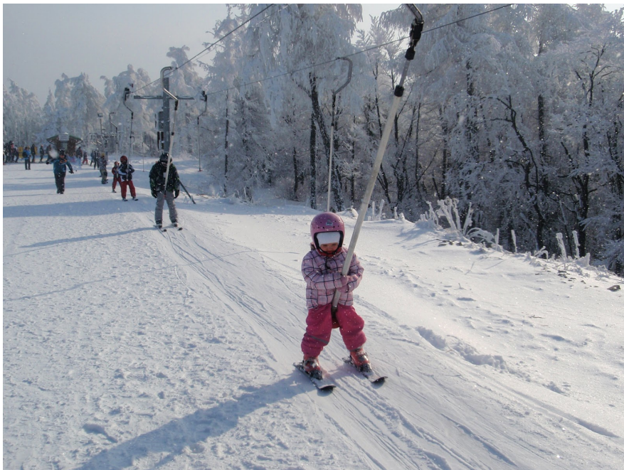
Польские горы хороши для лыжников всех возрастов

Воспользоваться можно также 9 подъемниками с «диванами» на 4 человека и 6 подъемниками другого типа. Есть также «подвижная дорожка» на гору для самых маленьких и лыжная детская школа, которая предлагает хорошие места спусков для детей.