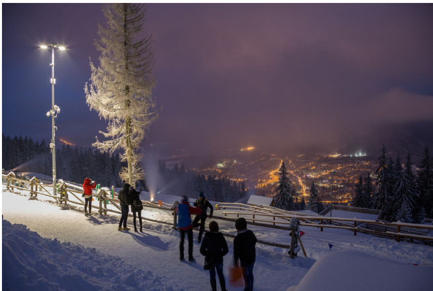
Закопано. Губалувка. Магия ночи

А любители «стремных» спусков могут направляться в лыжный центр Гаренда — кроме простых трасс для начинающих, здесь есть и черная трасса, сертифицированная Международной лыжной федерацией (FIS). На гору туристов поднимают кресельные и бугельные подъемники.