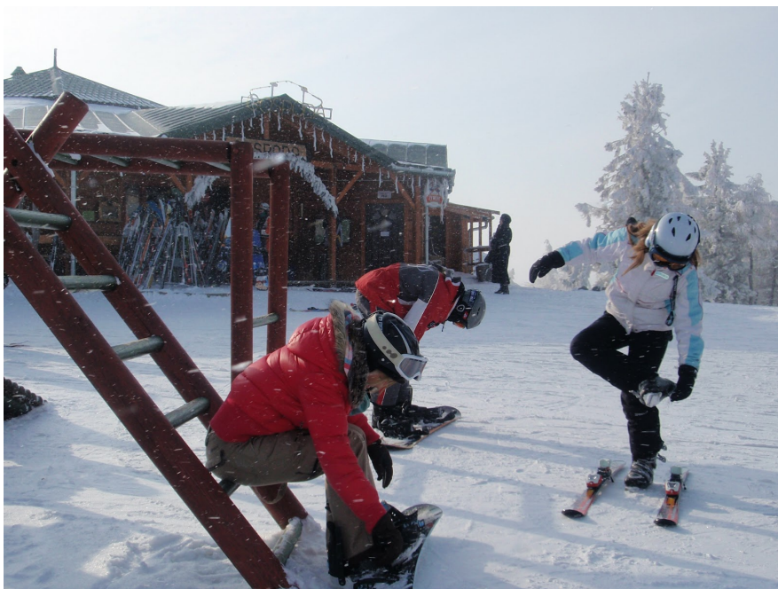
На горнолыжных курортах Польши отлично развита система аренды лыжного снаряжения.

В Яворине Криницкой большой выбор мест, где после активного отдыха можно изысканно и вкусно утолить голод, насладившись блюдами польской кухни. Гости города могут остановиться в гостиницах или частных пансионатах, а неподалеку от лыжной станции доступен паркинг на 800 автомобилей. Кстати, самый высокий уровень снега в Яворине Криницкой традиционно приходится на февраль – до 29 сантиметров.