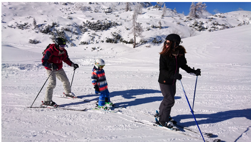
Польские горы – прекрасное место для лыжного отдыха всей семьей.

Сноубордисты будут чувствовать себя в своей стихии на лыжных базах Чирна-Солиско, Центрального центра спорта, Бескидек. Все трассы имеют лицензии Международной федерации сноубординга.