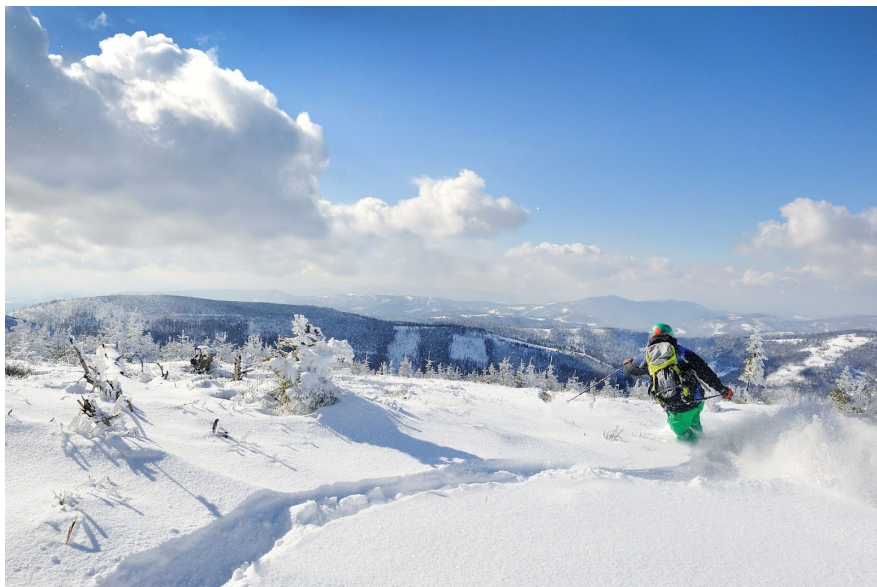
Щирк прекрасен в любое время года. Но зимой — особенно...

По количеству подъемников Щирк – на первом месте в Польше. К слову, большинством из них можно пользоваться без необходимости отстегивать лыжи. Незаурядное удобство! В Щирке есть четыре трамплина и трассы для поклонников беговых лыж.