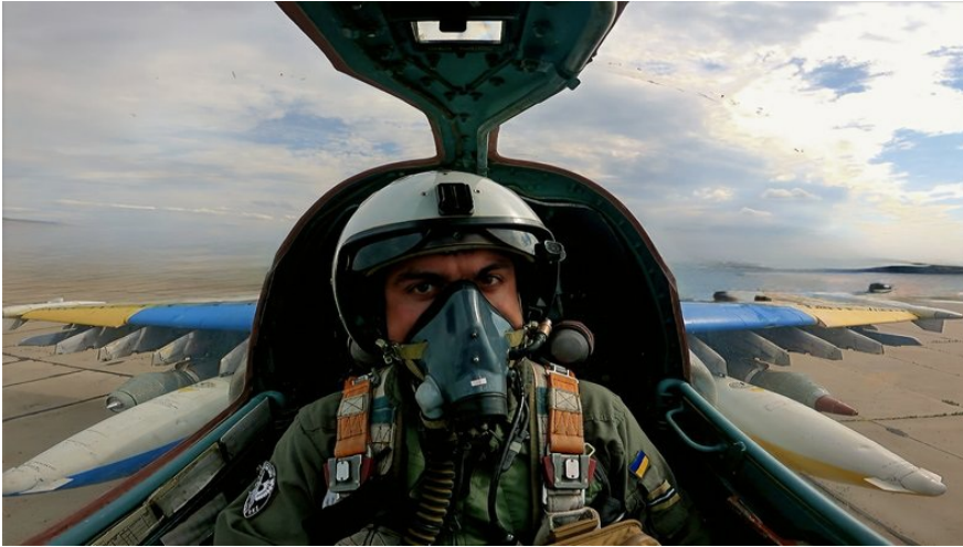
Пілот Су-25 на позивний "Пумба" під час виконання бойового завдання.

Читайте також: Бригадний генерал Повітряних сил ЗСУ: «Ми зможемо завоювати перевагу в повітрі»