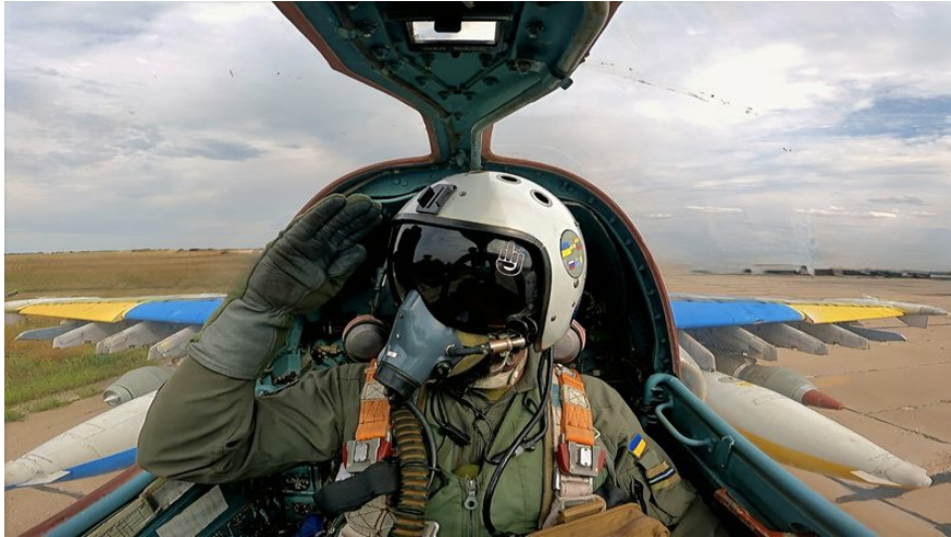
Пілот Су-25 на позивний "Пумба" під час виконання бойового завдання.

Другий раз — під час виконання бойових дій. Це був мій ведучий №1 в парі, Герой України Єгор Середюк. Ми тоді виконували завдання на Харківському напрямку в бік населеного пункту Барвінкове. І я пам'ятаю, як нам дали координати, щоб терміново завдавати удар, і це якраз був наш крайній політ на день, бо ми літаємо тільки вдень. Вночі ми не можемо літати, бо в нас немає приладів нічного бачення. Су-25 не пристосовані для того, щоб літати вночі, але ми пристосовані, щоб повертатися безпечно вночі.