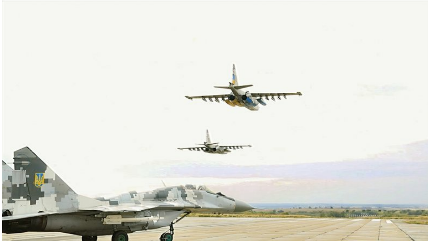
Су-25 в небі та на землі.

— Це — літак-штурмовик. Єдина бригада штурмовиків в Україні розташована у Миколаєві — 299-та бригада тактичної авіації імені Василя Никифорова. Пілоти Су-25 працюють безпосередньо на лінії бойового зіткнення для підтримки сухопутних військ. Якщо нашим побратимам з піхоти або з інших наземних підрозділів треба допомога, то тут вступає в дію штурмова або армійська авіація. І взагалі наше поле дій — тільки по ворогу, який перебуває на землі. Тобто ми не займаємось перехватами ракет та знищенням дронів.