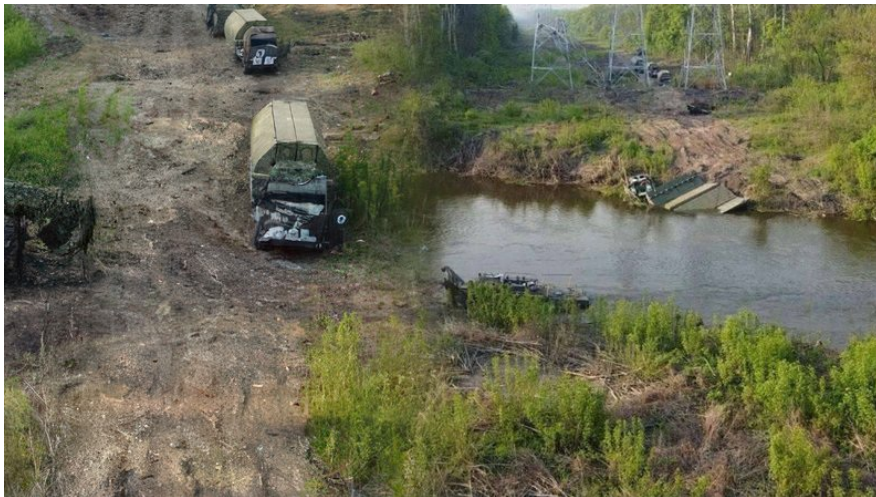
Розбиті російські позиції біля Серебрянського лісу на Луганщині, які атакував пілот "Пумба".

Це умовно 100 кілометрів. Я завдаю удар, розвертаюся і бачу, що в мене один двигун відмовив. А на одному двигуні швидко не зможу піти. І мені ведений кричить: "Давай скоріше!". Я: "Не можу, двигун відмовив". Я згадую, що робити в такій ситуації. Перезапустив двигун, він вийшов на задані оберти, і ми вже з моїм ведучим, нам дуже сильно пощастило, втекли звідти. Але дуже багато було моментів, коли по нас запускали ракети, ми відходили, маневрували.