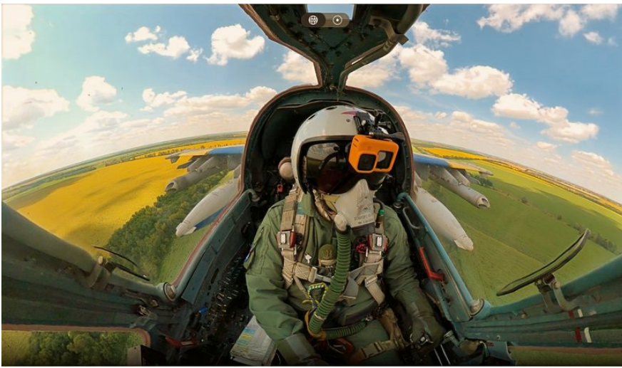
Пілот Су-25 на позивний "Пумба" під час виконання бойового завдання.

І потім, коли ми підлітали до Києва, погода була дуже різноманітна. Ми злітали в центрі України — сонячно, підлітали до Київської області — хмарно. Підлітали до Києва — були опади: мокрий сніг з дощем. Ми пролітали над Києвом, над районом Позняки, і таке відчуття, що я тут був, я тут колись проїжджав на трамваї, тролейбусі, а зараз я тут пролітаю. І в той момент я ніби згадав все своє життя. Але Київ швидко промайнув.