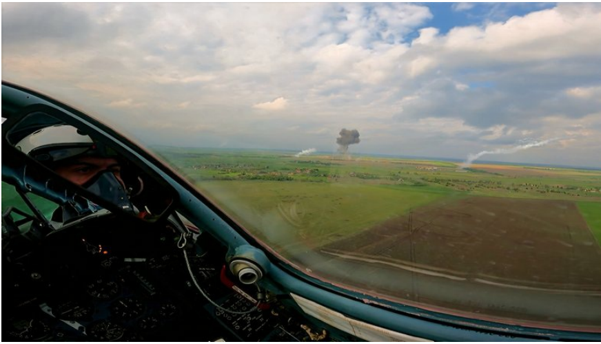
Пілот Су-25 на позивний "Пумба" під час виконання бойового завдання.