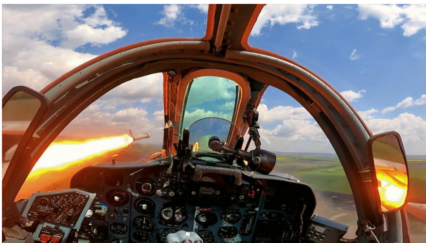
Пілот Су-25 на позивний "Пумба" під час виконання бойового завдання випускає ракети по російських позиціях.

Читайте також: В Україні розбився переданий ЗСУ винищувач F-16