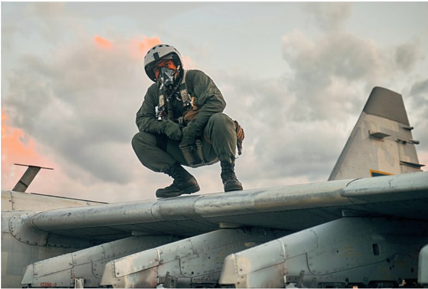
Пілот Су-25 на позивний "Пумба". libkos