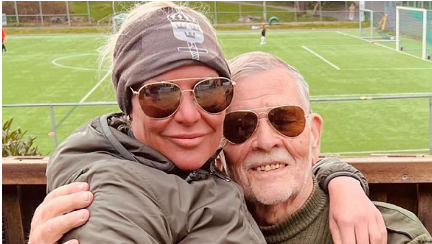
Каролін разом чоловіком.

основних завдань команди Каролін в Україні - підтримка молоді та проектів з демократичного розвитку держави.