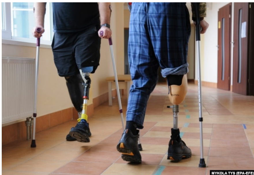
Поранені українські військові у реабілітаційному центрі у Львівській області. 22 лютого 2023 року.

Зрештою, після проходження МСЕК поранений може отримати допомогу від держави. Розмір виплат – від 124 500 гривень (приблизно $3400), якщо військової частково втратив працездатність до 992 400 гривень (близько $27 000), якщо поранення призвело до першої групи інвалідності. Для Семена все оформлення зупинилося на початку шляху: майже рік він не міг отримати в частині довідку про обставини травми та направлення на ВЛК. Каже, що у частині його не встигли оформити до поранення, а потім уже не хотіли зі служби відпускати на комісію. "Ти приїжджаєш, кажеш безпосередньому командирі: мені треба лікуватися. Командир передає командирі роти. Командир роти каже: я піду до медиків. На якомусь етапі процес буксує, ти приходиш до свого командира, а командир каже: немає часу, давай потім". Або якщо твій медик не хоче цим займатися, ти застряєш на місці», – каже Семен Гаранов.