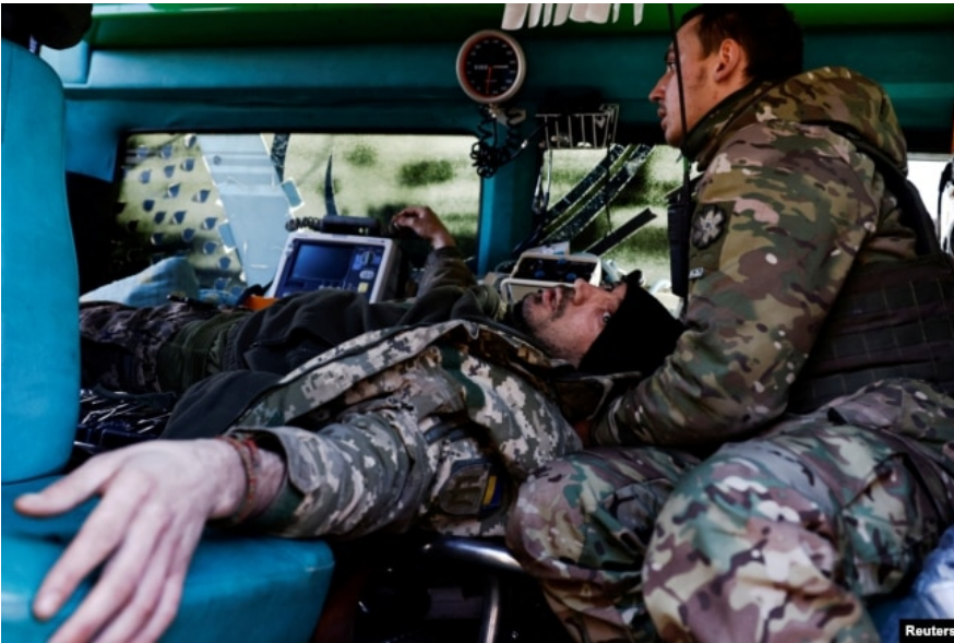
Військові медики допомагають пораненому в медичному автомобілі на лінії фронту неподалік Кременної. 13 березня 2023 року.