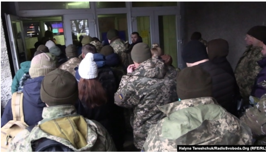
Поранені українські бійці біля входу до клініки у Львові, лютий 2023 року.