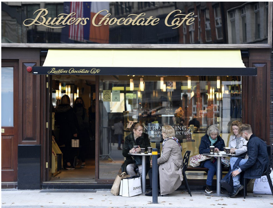
Дублін, Ірландія, 21 жовтня 2020 р.