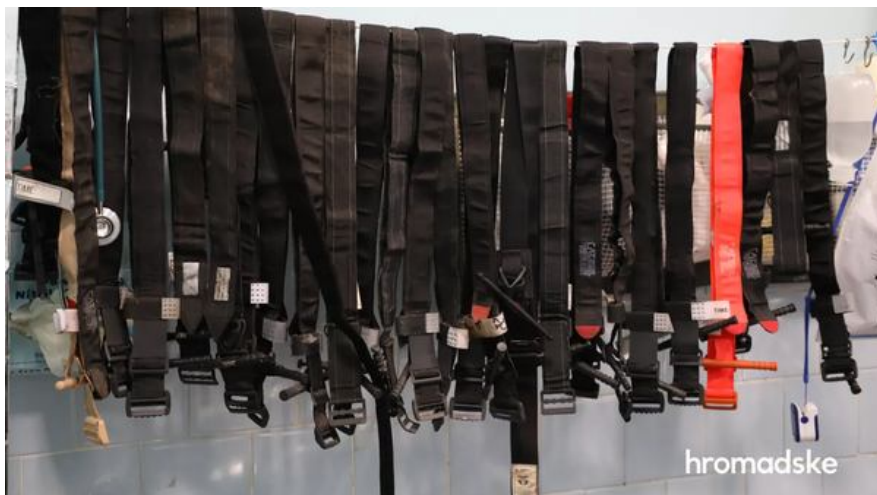
Турнікети у стабілізаційному пункті під Бахмутом

Читайте також: Звернення волонтерського руху до воєнного керівництва: 8 проблем тактичної медицини в Силах оборони України