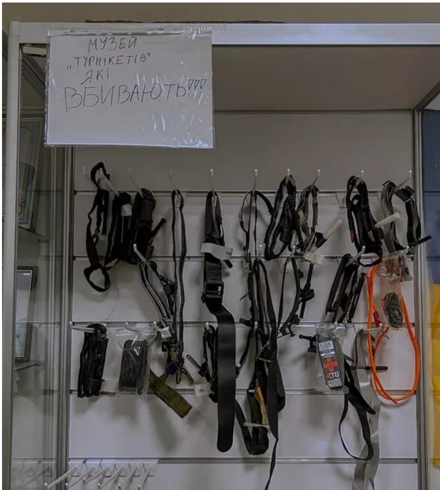
Музей турнікетів-вбивць у Харкові

Читайте також: Тактична медицина в Україні: стрибок від радянщини