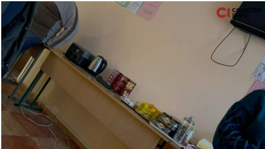
Пункт незламності / школа № 316

В тему: Виявляється, ми могли б мати автономне світло і тепло з газових котелень на дахах ще з 2018-го