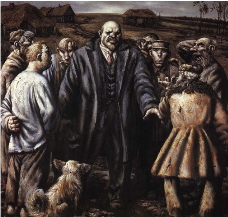
Художник Василь Шульженко

Боротьба зі Злом, уособленням якого нині є московія, – це багатоаспектна, високотехнологічна дія, яка потребує глибинних знань. Щоб перемогти ворога, треба володіти не лише сучасною зброєю, треба докладно вивчити соціальне буття противника, знати його історію, ментальність, культуру. На цій своєрідній матеріальній частині добре розуміється великий музикант, всесвітньо відомий радянський, російський, британський, німецький і швейцарський піаніст і диригент Андрій Гаврилов. Його думки варті уваги.