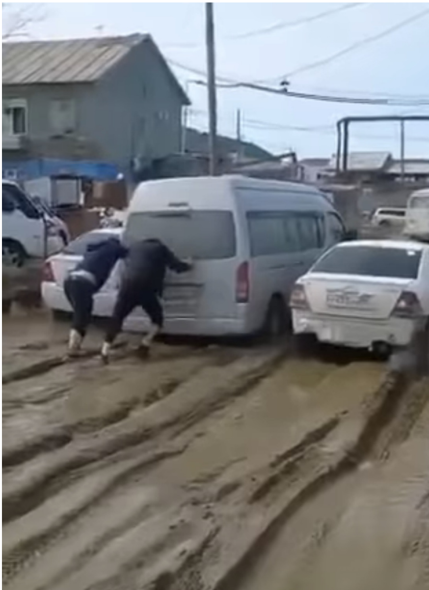
Якутськ. РФ. XXI століття.

Ми бачимо, що наші дикуни, володіючи великою кількістю готівки, яку викачують із землі, успішно корумпують цивілізацію, отупляють людей. Цивілізація, яка втратила позитивну інерцію ідеалів, яка згодна за гроші подурнішати, робить це семимильними кроками. А це розкладання, декаданс цивілізації. Цьому сприяє забруднення західної цивілізації російськими дикунами, оскільки вони зараз мають інструменти корупції».