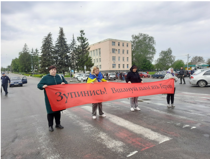
Хвилина мовчання в Богуславі

Раніше в Богуславі транспорт не зупинявся під час хвилини мовчання. Коли волонтери почали про це говорити, поліція долучилася до перекриття доріг без проблем. Водії спочатку не виходили з машин, обурювалися і намагалися об'їхати центр. А тепер чомно стають і чекають. Бо хвилина глобально ні на що не вплине, зате дасть змогу вшанувати пам'ять.