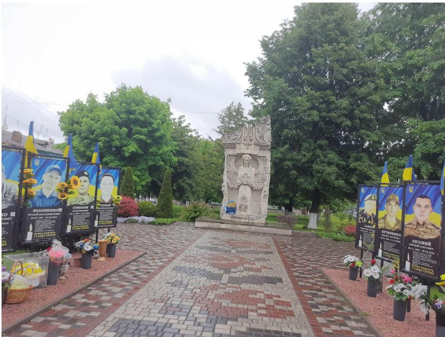
Меморіал полеглим у російсько-українській війні. Кагарлик, Київська область.