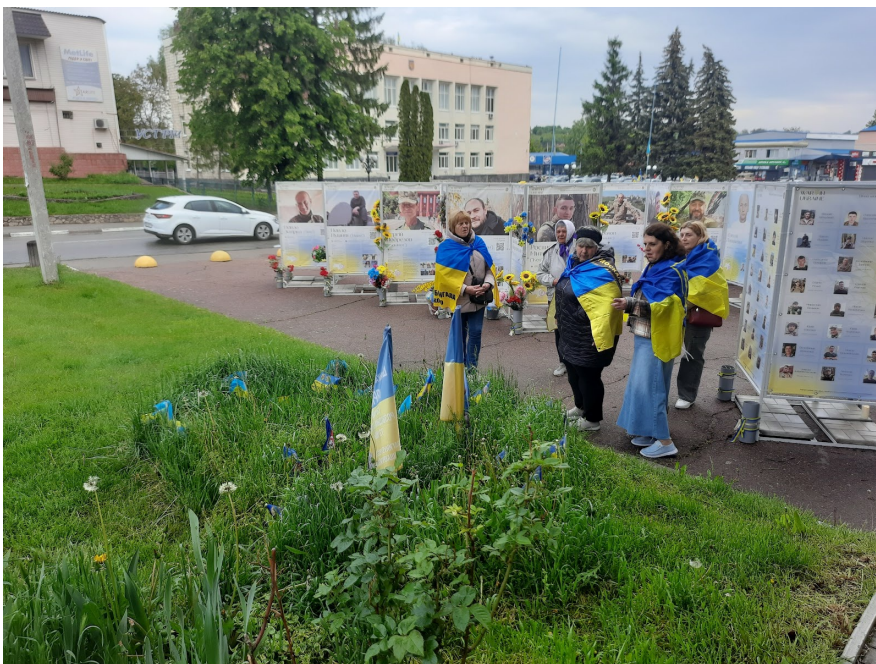
Матері полеглих воїнів стоять біля прапорців, поставлених на міському газоні. Комунальники цю ділянку оминають увагою і не доглядають.

У Богуславі о 8-й ранку на центральній площі вже стоять рідні полеглих воїнів. Газон біля пам'ятника Небесній сотні акуратно підстрижений. Але ділянку, де матері загиблих поставили прапорці у формі серця, комунальники не чіпають. Прапорці не прибирають, але й газон не доглядають.