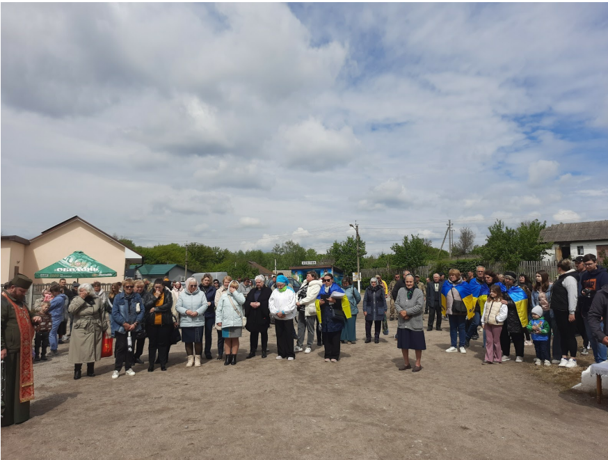
Збори в Хохівті на виставці, яку привезли в село волонтери