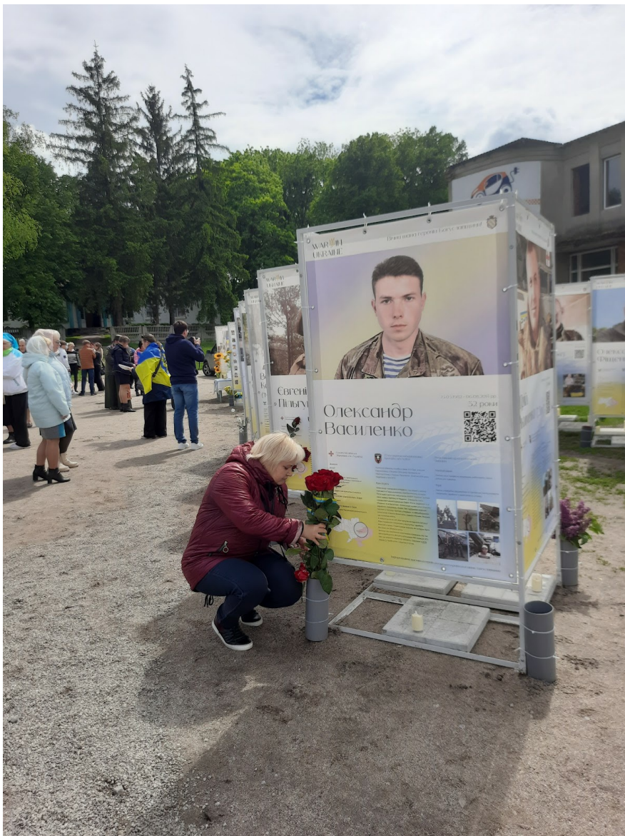
Виставка банерів з історіями про полеглих бійців у селі Хохітва.