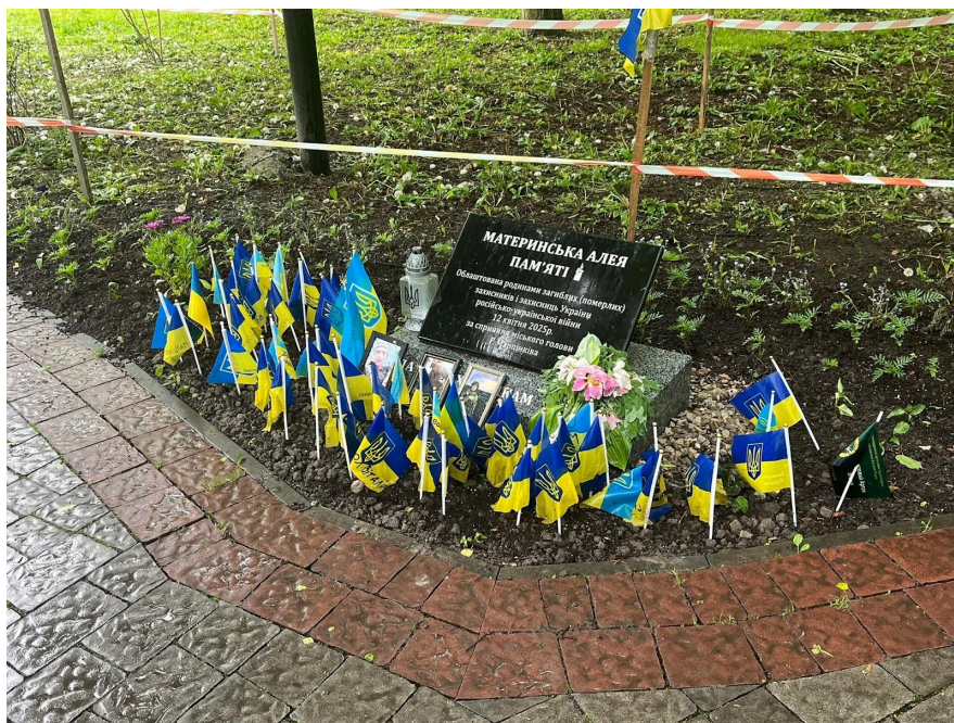
Гранітна плита на алеї в Івано-Франківську