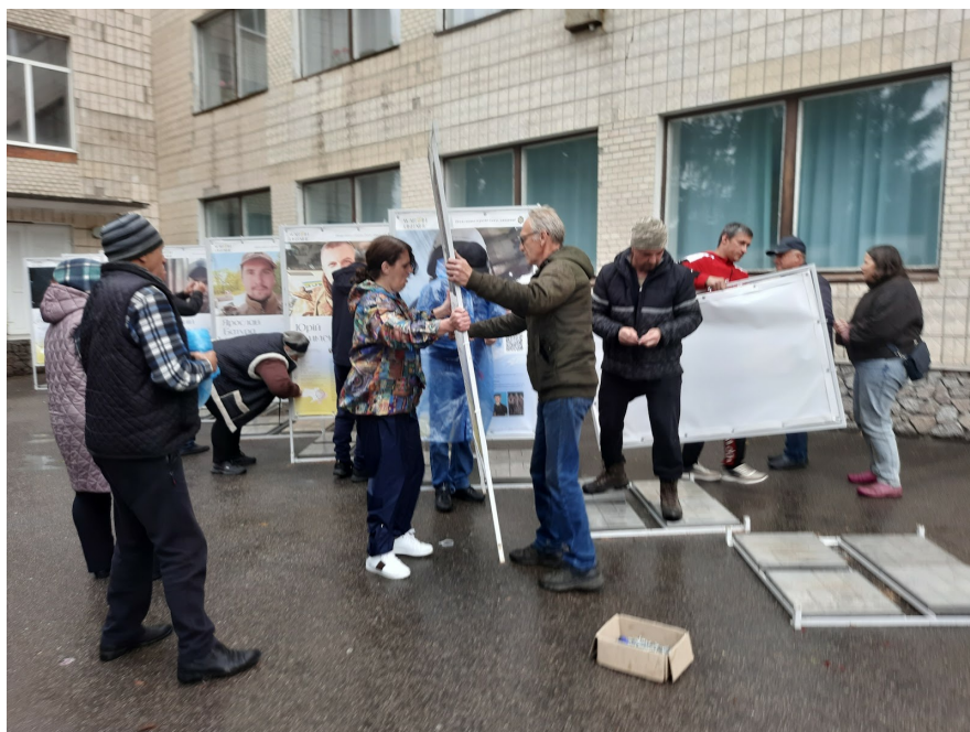
Розбір виставки в Богуславському коледжі.

Ще вчора ці банери були на території Богуславського гуманітарного коледжу. Рідні й близькі загиблих розбирали їх і залізні каркаси, щоб перевезти в село. «Клац-клац» — різалися кусачками стяжки, які тримали банери, дзенькали в картонну коробку болти й гайки, вантажилися в білий бус усі необхідні елементи. Зазвичай ця робота займає багато часу, бо постійних активістів і активісток не так багато. Бувало, що на холоді аж зашпори в пальці заходили.