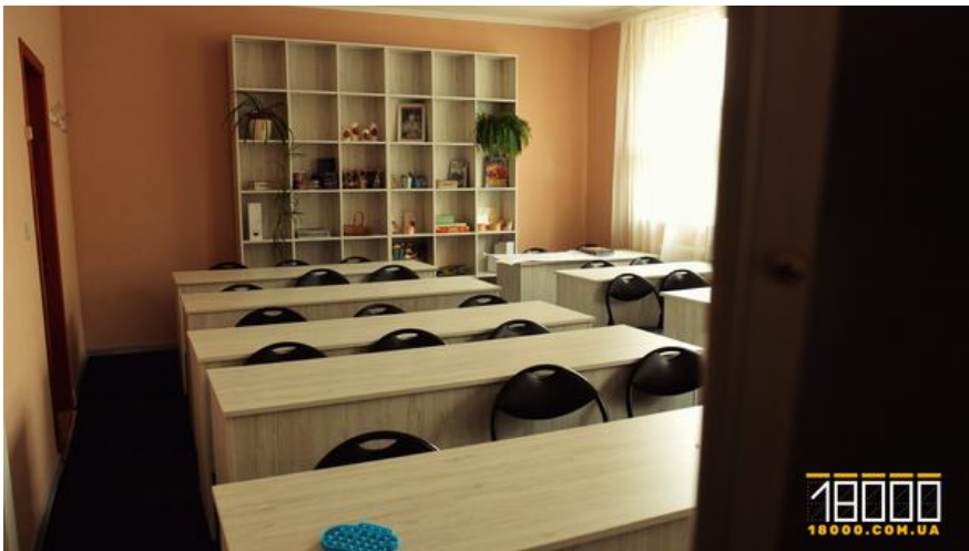
Приміщення недільної школи черкаського собору

У планах – повністю освітлити будівлю собору та побудувати ще одну котельню.