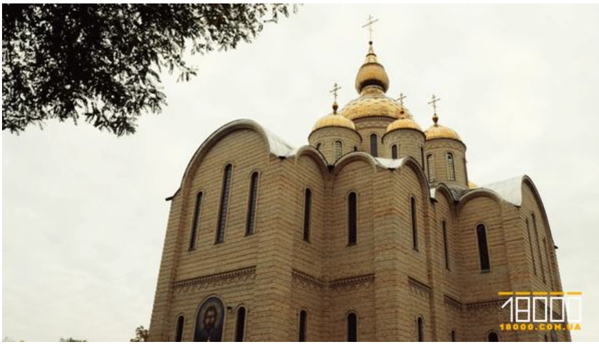
Свято-Михайлівський собор у Черкасах

На жаль, ситуація в області лишається більш сумною. Найбільші й найстаріші храми Черкащини (як-от, Красногірський монастир на Золотоніщині чи Мотронинський на Чигиринщині) не поспішають відмовлятися від російського коріння. Одна з причин – більш складна юридична процедура переходу для монастирів. Хоча, певно, ключовою є інша – відсутність політичної волі місцевих феодалів, на яких, схоже, поки не поспішають «тиснути» згори.