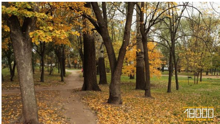
Парк на території Свято-Михайлівського собору