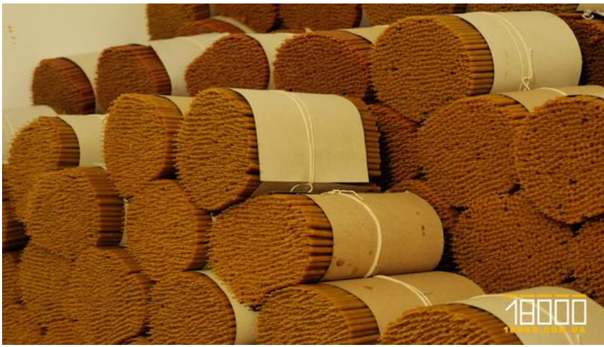
Свічки, що виробляють у Свято-Михайлівському храмі