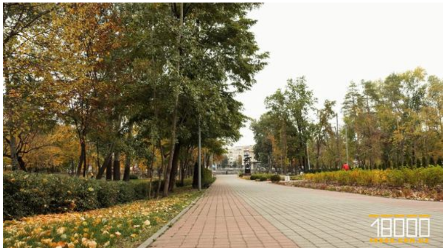
Алея в парку «Соборний» у Черкасах

Подальші судові процеси фінішували аж в березні 2024-го. Влітку 2025-го землю передали комунальникам, і там створили парк «Соборний».