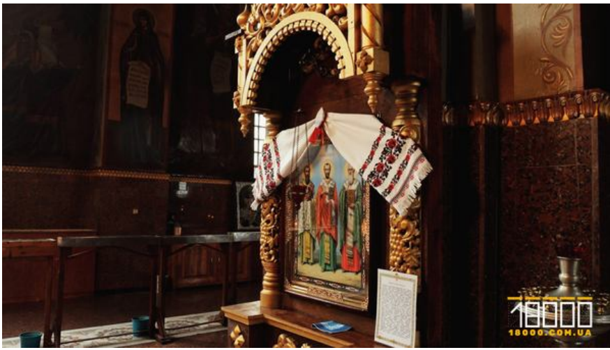
Ікона з рушником у Свято-Михайлівському соборі Черкас