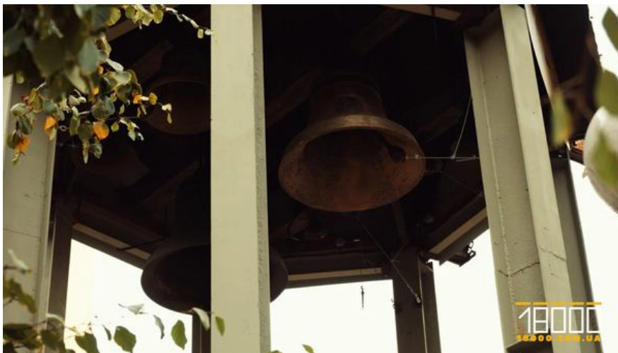
Дзвіниця на території собору

Поїхати за кордон і розповісти на сесії ООН про утиски вірян теж у нього не вийшло . Суд не відпустив.