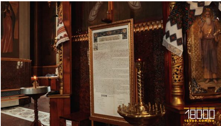
Копія Томоса в черкаському храмі