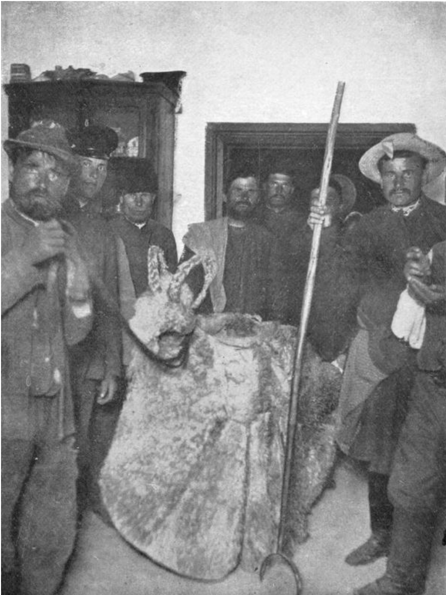
1915 рік. Колядники водять козу. Ілюстрації до «Матеріалів з народної словесності Полтавської губернії. Роменський повіт».

Усі фігурки були дерев'яні, окрім Пресвятої Богородиці – вона була порцелянова. Ще одна особливість – кожна мала свою механіку, наприклад, на моменті коли Смерть відтяла голову царю Іроду, у нього дійсно відлітала голова.