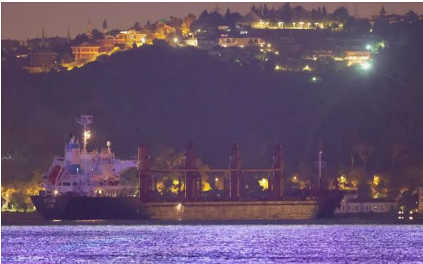
10 липня 2023 року судно «Св. Ольга», завантажене зерном з окупованої України, проходить через протоку Босфор, прямує до Ізраїлю.

Використання старих суден, зміна прапорів на екзотичні (на кшталт Панам чи Ліберії) та маніпуляції з GPS-сигналами стали новою нормою в Чорному морі. Якщо міжнародні морські організації (IMO) та уряди країн-споживачів не почнуть жорстко карати за вимкнення AIS та сумнівні STS-перевалки, Чорне море остаточно перетвориться на «сіру зону» глобального піратства.