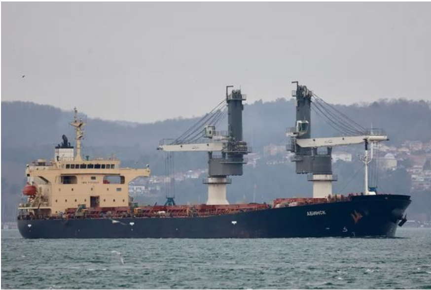
Судно «Абінськ», що проходить через протоку Босфор з вантажем викраденого зерна для Ізраїлю, 19 березня 2026 року.