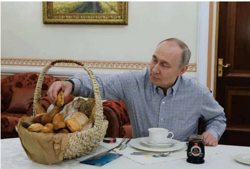
Президент Путін з випічкою в Москві. 2025 рік. Завдяки великим зерноробним районам Україна отримала назву «житниця Європи».

Тоді міжнародна спільнота впровадила Кімберлійський процес, щоб сертифікувати походження кожного каменю. Сьогодні українське зерно потребує аналогічного механізму — глобального «зернового паспорта», який би унеможливив легалізацію вкраденого врожаю через змішування з легальним зерном у плавучих сховищах.