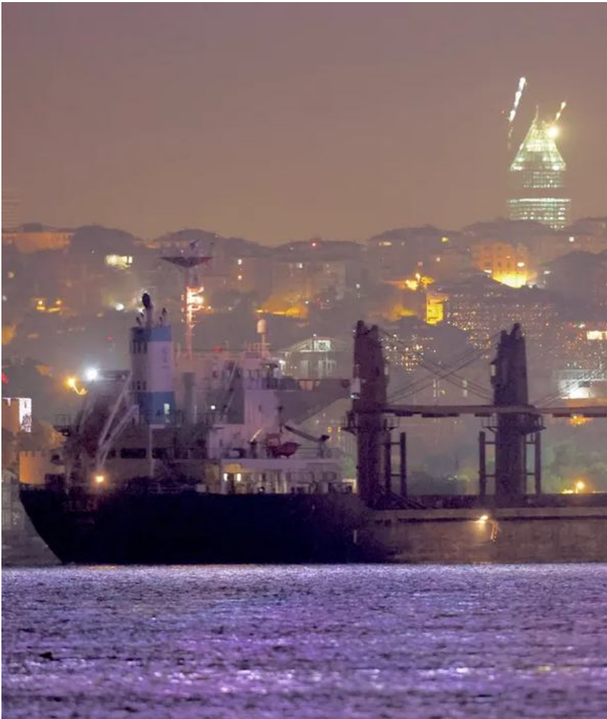
10 липня 2023 року судно «Св. Ольга», завантажене зерном з окупованої України, проходить через протоку Босфор, прямуючи до Ізраїлю.

Кожна така транзакція — це мільйони доларів, які йдуть безпосередньо в російську казну. Найбільш цинічним є те, що ізраїльські покупці, такі як ADM Israel, запевняють у своїй необізнаності, посилаючись на бездоганно підроблені російські сертифікати якості. Це демонструє критичну вразливість світового ринку перед обличчям державного мародерства.