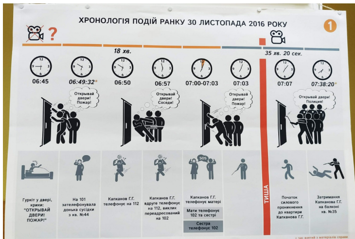
Хронология событий утра 30 ноября 2016 года на основе материалов дела