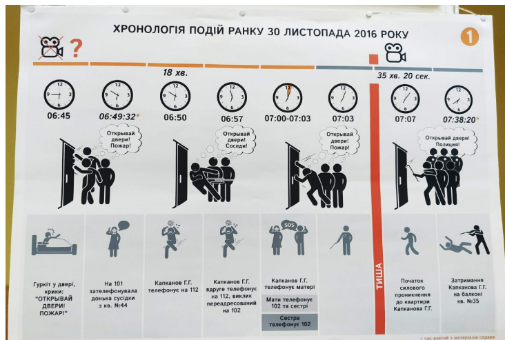
Хронология событий утра 30 ноября 2016 года на основе материалов дела