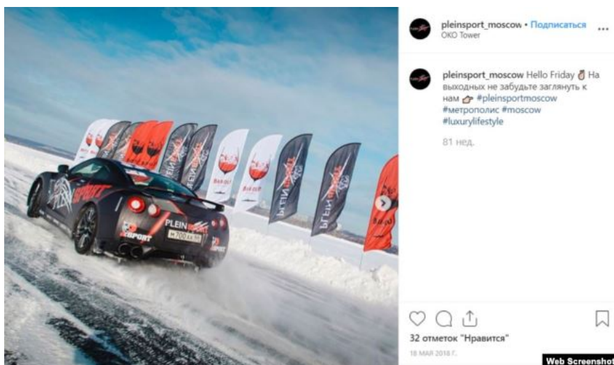
Брендированный Nissan GTR в инстаграм-аккаунте магазина Plein Sport, с номерным знаком, ранее замеченным на Audi одного из участников хакерской группировки Evil Corp