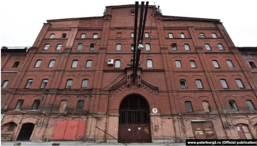
Завод им. Степана Разина