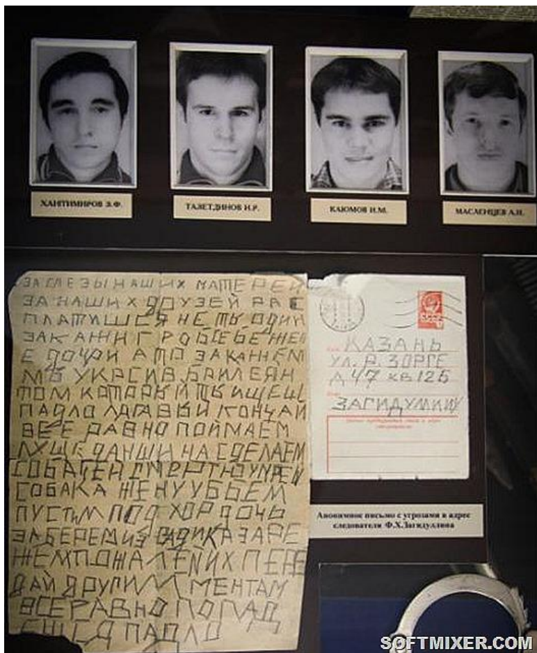
Члены банды «Тяп-Ляп» и их «открытка», экспонат из музея МВТ Татарстана

Демонстративную и кровавую акцию запугивания «Тяп-ляповцы» устроили во «Дворце культуры им. Урицкого» во время дискотеки. Ворвавшись в помещение, они железными прутьями стали калечить находящихся в здании молодых людей. Даже серьезно травмированные подростки не жаловались в милицию – боялись расправы.