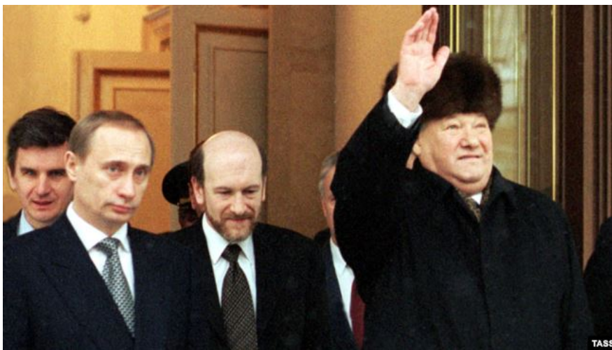
Борис Ельцин (справа) покидает Кремль после официальной церемонии передачи власти Владимиру Путину (крайний слева)

В корпорацию "Двадцатый трест" вливались огромные финансы, и для того чтобы этот механизм коррупции в городе действовал благополучно, необходимо было подмазать или коррумпировать все органы: санэпидстанцию, пожарных, таможен, валютно-экспортный контроль. И самое идеальное было – предложить квартиру вот этим руководителям. Квартиры предлагались родственникам, членам семей, отцу, матери – улучшалось их жилищное положение.