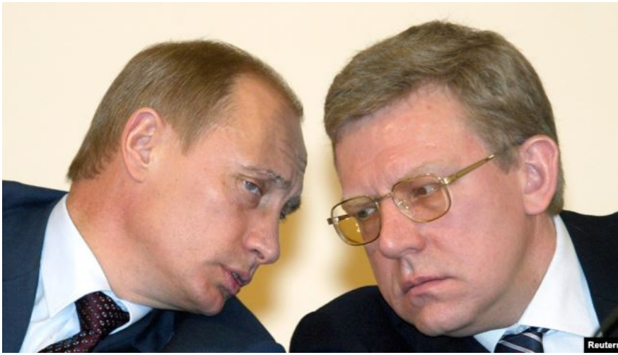
Президент Владимир Путин и министр финансов Алексей Кудрин беседуют друг с другом во время встречи министров экономики в Москве, 19 марта 2004 года