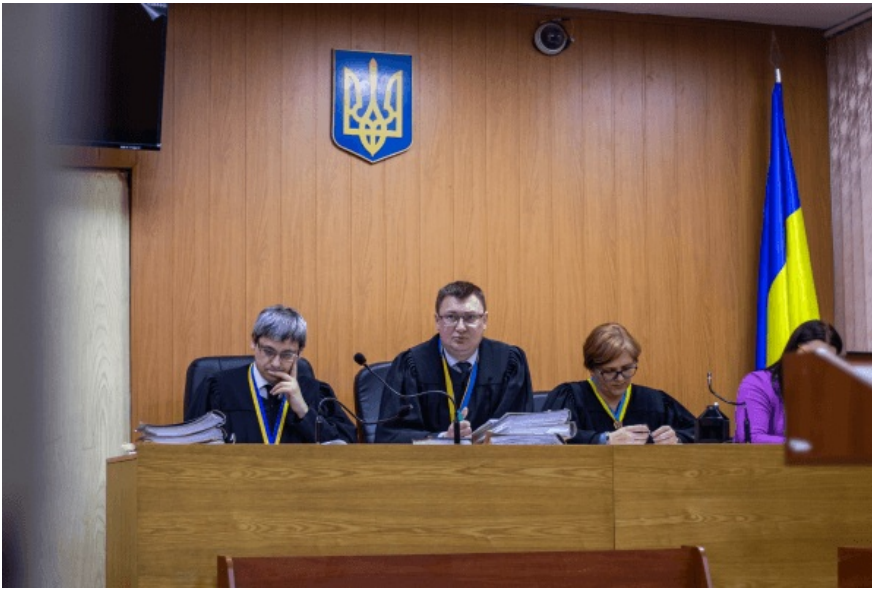
Коллегия судей в Бориспольском горрайонном суде.