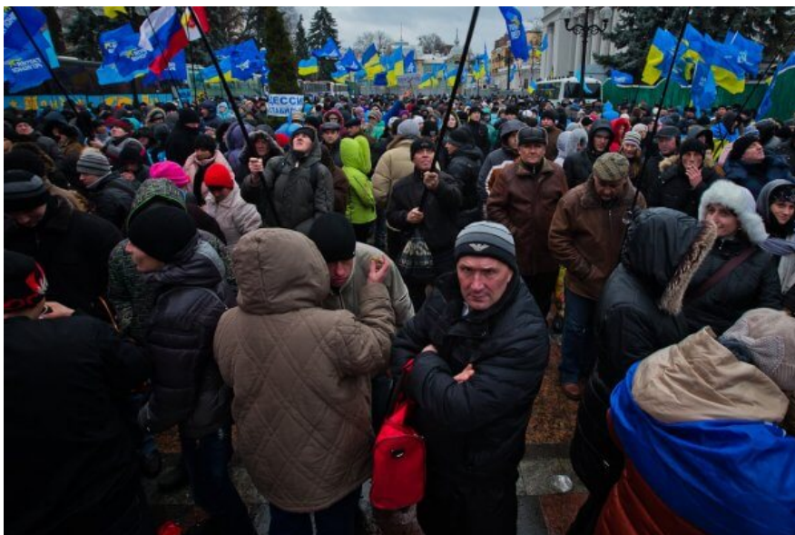
Антимайдан в Мариинском парке.

Волков отрицал, что мог финансировать действия титушек на Майдане. При этом он отказался отвечать на вопросы об источниках своих доходов. По версии следствия, — это деятельность преступной группировки. Эту версию обвиняемый отрицал.