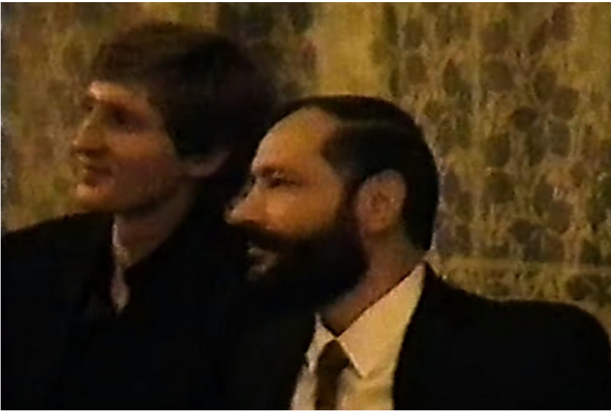
Рінат Ахметов.

— Вы для себя установили, кто на самом деле является заказчиком убийства вашего отца?