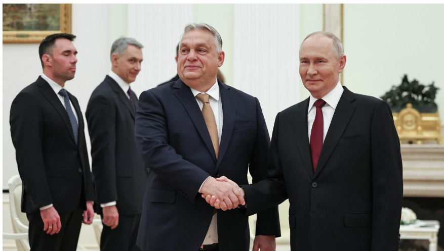
Віктор Орбан і Володимир Путін

Коли Орбан балотувався як опозиціонер, усі ці вибухи та вбивства, що обурювали суспільство, сприяли зростанню його рейтингу, але, коли він прийшов до влади, його колишні друзі та спонсори стали йому на заваді, і він за допомогою того самого Пінтера швидко їх позбувся, засунувши їх усіх за ґрати. Довелося виїхати з Угорщини і самому Могілевичу. Наскільки мені відомо, він перебрався до Росії. Чи можуть російські власті використовувати той компромат, який є у Могілевича на Орбана? Достовірно мені про це нічого не відомо, але я думаю, що, звичайно, можуть.