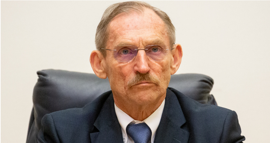
Шандор Пінтер, головний поліцейський Угорщини, а згодом — міністр внутрішніх справ

Читайте також: Прем'єрміністр Угорщини Орбан нацистською промовою спричинив гучний політичний скандал