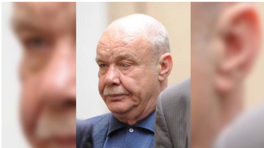
Семен Могилевич («Сева»)

Йому туди привозили й їжу, й жінок, туди стікалася вся інформація, там вирішувалися всі питання. Взагалі у Севи угруповання були скрізь, наприклад у Росії — солнцевські, були угруповання по всій Україні, у США, втім, про це я знав лише з чуток.