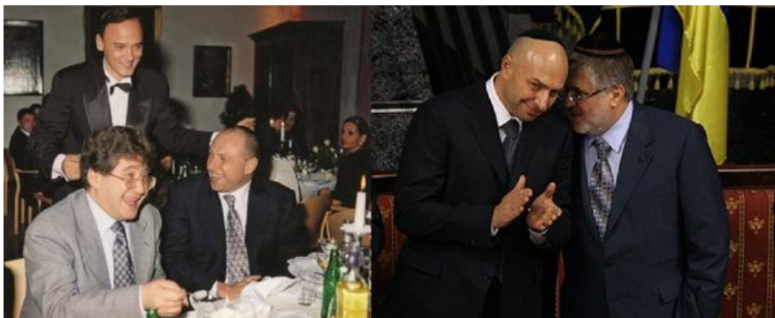
Ігор Коломойський і Геннадій Боголюбов ведуть спільний бізнес і дружать понад 20 років. На фото ліворуч бізнесмени під час застілля в 1997 році. На фото праворуч у синагозі «Золота Роза» в Дніпропетровську 25 листопада 2010 року

Придивившись до профілів цих компаній уважніше, суддя здивувався. Вони часто мали одного-двох працівників, купу збитків та абсурдний бізнес-план, за яким дохід повинен був зрости в тисячі разів без жодного пояснення.