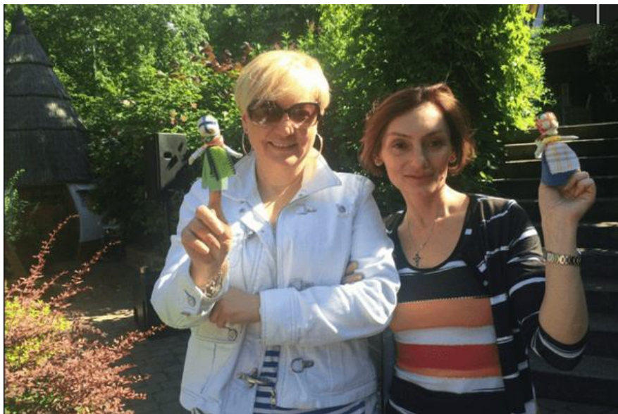
Голова Національного банку України Валерія Гонтарева та її заступниця Катерина Рожкова кажуть, що отримували погрози від Ігоря Коломойського через те, що держава націоналізувала ПриватБанк

На цю зустріч Ігор Коломойський прийшов у поганому настрої. І після слів Гонтаревої «ми не бачимо жодного прогресу» пригрозив їй: якщо НБУ націоналізує банк, він просто переїде до Ізраїлю. А тоді додав: «У мене дуже довгі руки».