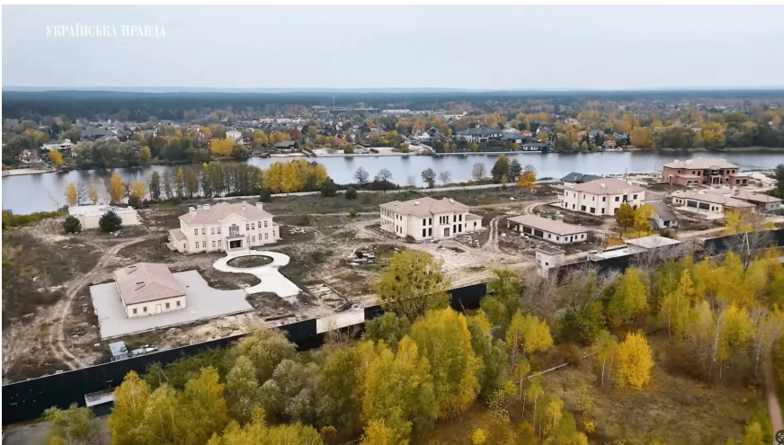
Той самий кооператив "Династія"