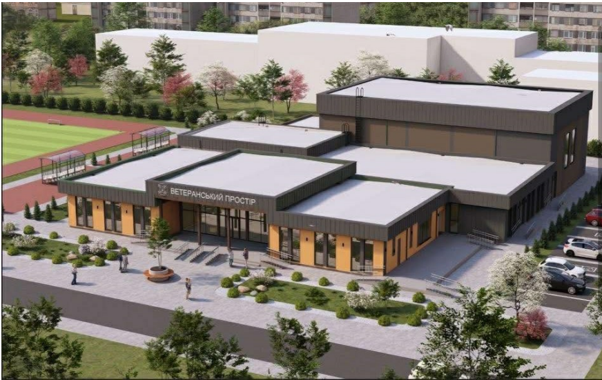
Візуалізація типового ветеранського простору, загалом у межах державної програми планують збудувати понад 160 таких об'єктів

Держава покриває до 60% вартості будівництва, решту має докласти місцева громада. Гроші підуть лише на нове будівництво і лише за типовим проектом міністерства, тобто їх не можна використати на ремонт чи облаштування уже працюючих ветеранських просторів.