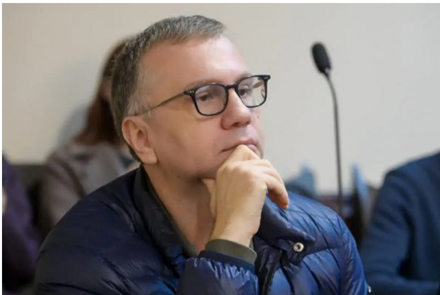
Павло Вовк у Вищому антикорупційному суді.

У 2019 році Національне антикорупційне бюро опублікувало аудіозаписи , що отримали назву "плівки Вовка". На записах, за даними слідства, судді ОАСК, у тому числі Вовк, і представники судової влади та юридичної спільноти обговорюють подання позовів для впливу на діяльність Вищої кваліфікаційної комісії суддів, що на той момент проводила кваліфікаційне оцінювання всіх суддів та конкурси в окремі суди. А також ймовірного впливу на відбір членів Вищої ради правосуддя, суддів Конституційного Суду тощо.