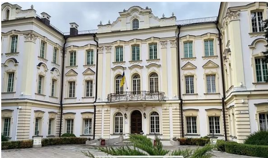
Кловський палац, де засідає Велика Палата Верховного Суду.