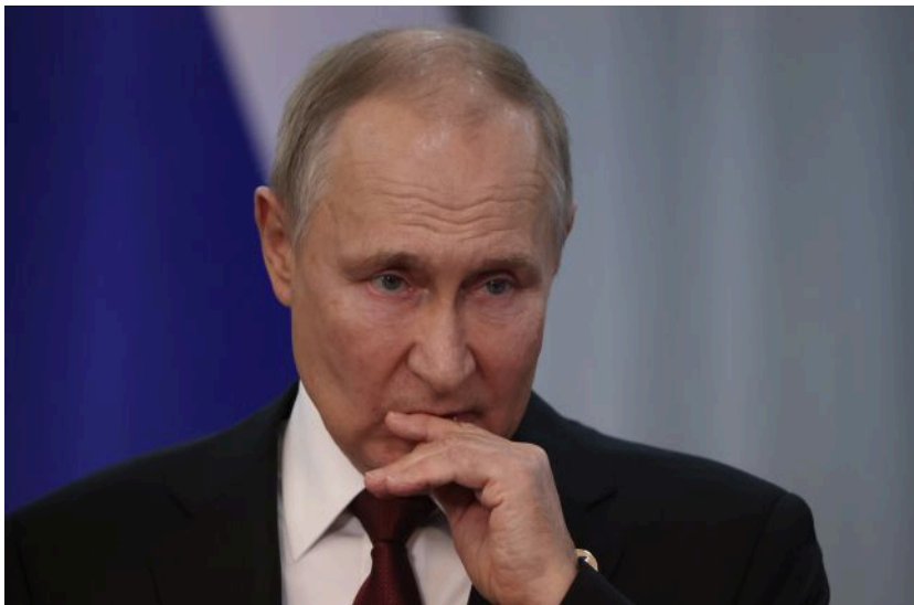
Фото: диктатор РФ Путін