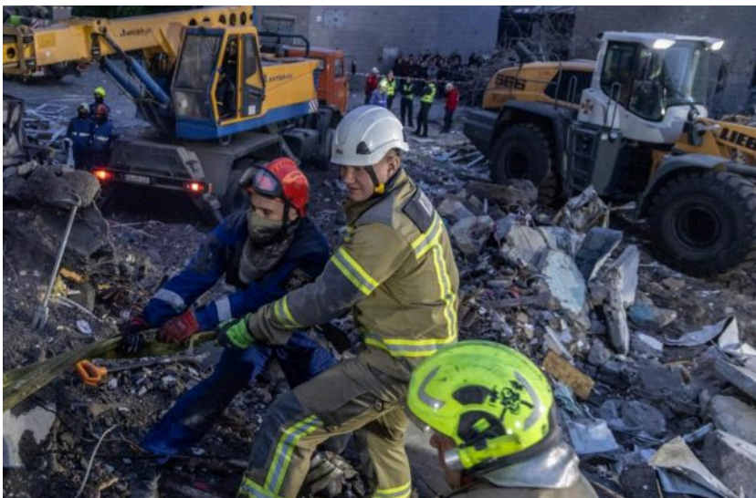
Фото: служби продовжують пошуки зниклих людей

Обирайте перевірене - додайте РБК-Україна до улюблених джерел у Google