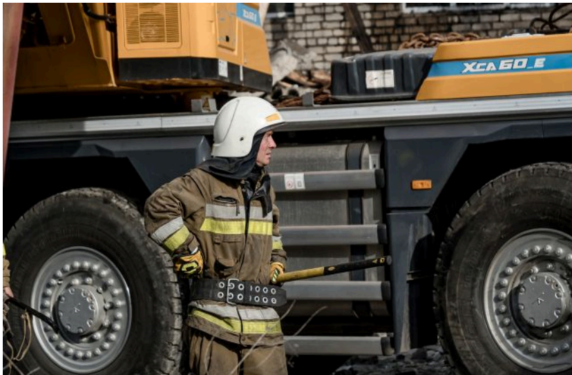
Фото: служби продовжують пошуки зниклих людей (Getty Images)