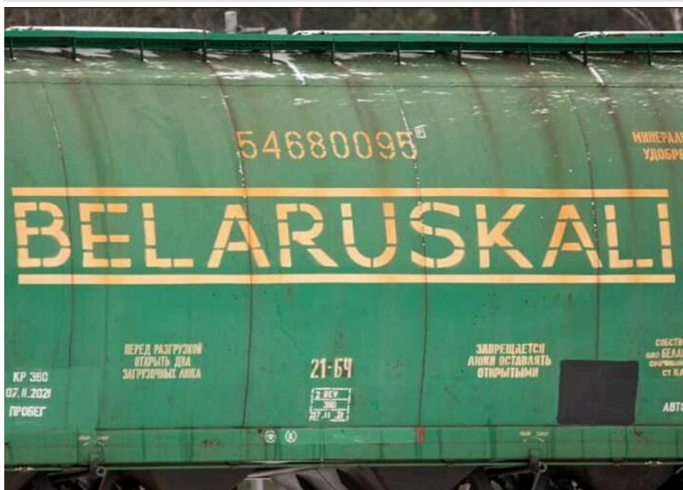
США обговорюють відновлення транзиту білоруських калійних добрив через Литву

Сполучені Штати домагаються обговорення питання про можливе відновлення експорту білоруських калійних добрив через територію Литви.