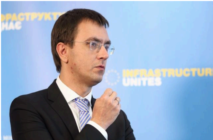
Фото: Володимир Омелян (Віталій Носач, РБК-Україна)