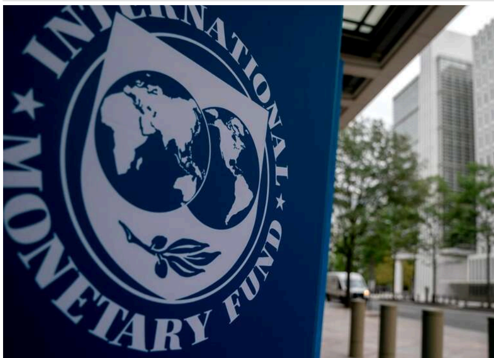
Податки на посилки та ФОПи: МВФ їде в Україну перевіряти розширення бази оподаткування

Місія МВФ вирушить до України найближчими тижнями для оцінки виконання умов кредитної програми на $8,1 млрд.