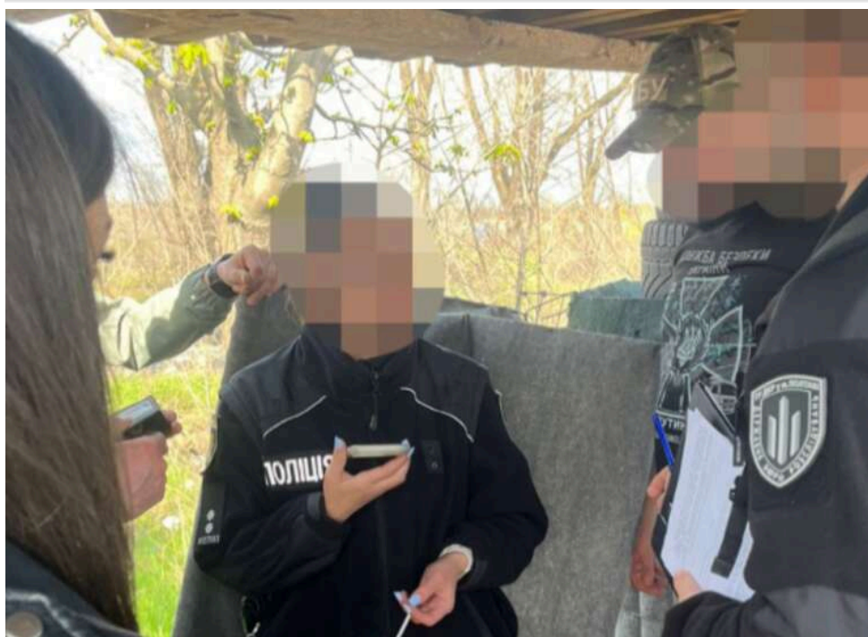
На Дніпропетровщині затримали посадовицю за вимагання 3 тисяч доларів за фіктивну службу

Працівники ДБР у взаємодії із СБУ затримали під час одержання хабаря працівницю правоохоронного органу з Дніпропетровської області