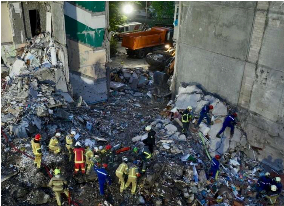
У Києві вже 16 жертв масованого удару: пошуково-рятувальна операція триває

Кількість жертв після нічного удару по Києву продовжує зростати в міру проведення пошуково-рятувальних робіт.