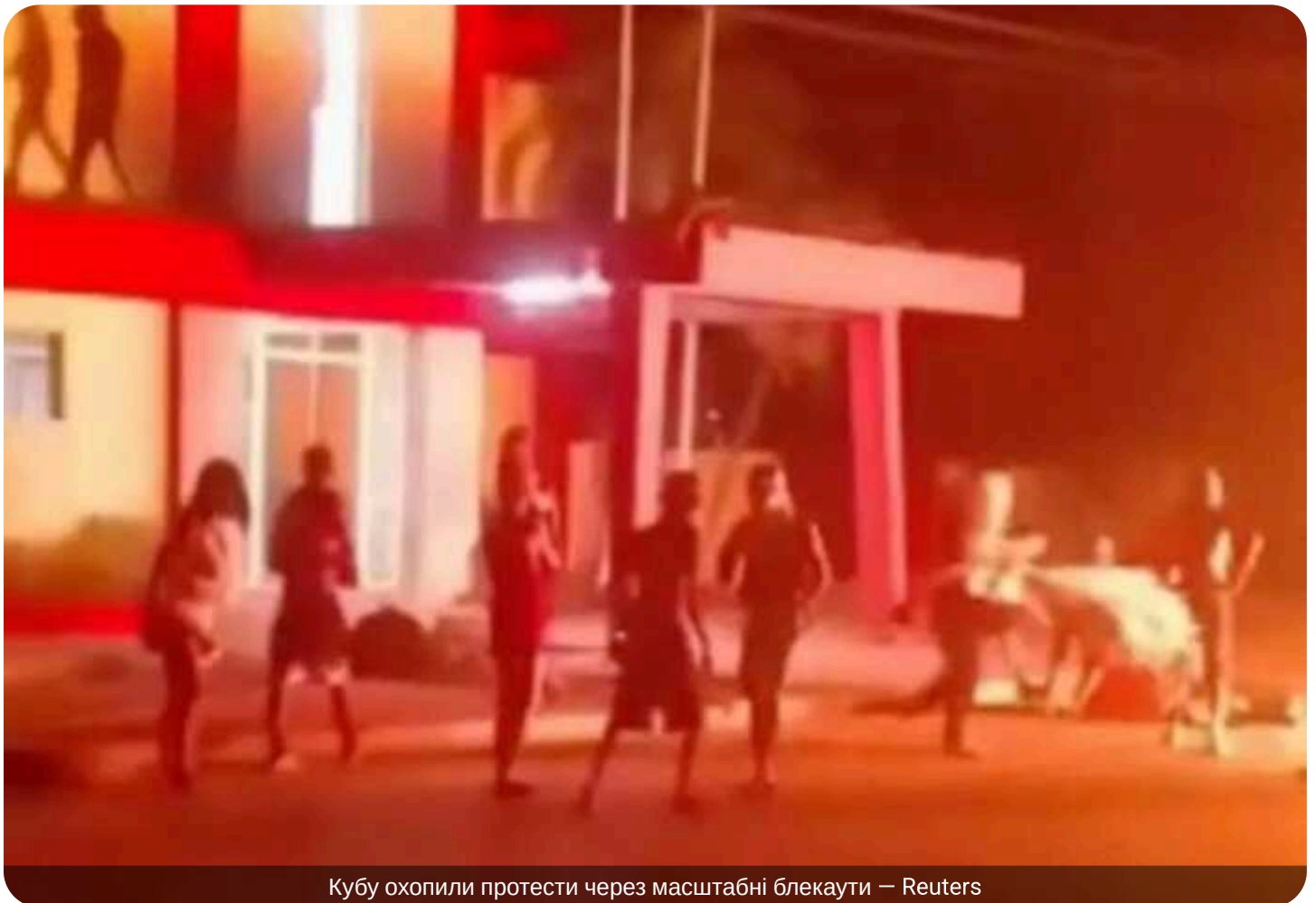
Кубу охопили протести через масштабні блекауты

На Кубі спалахнули протести через тривалі відключення електроенергії та критичну ситуацію в енергосистемі країни.