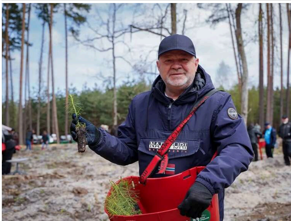
«Дерева – це головний бар'єр?»: мешканці Бучі звинувачують владу у варварстві через масову вирубку на вулиці Енергетиків

У Бучанській громаді мешканці міста Буча розкритикували масове зрізання дерев на вулиці Енергетиків, де триває масштабна реконструкція в межах проекту «Рух без бар'єрів». Частина містян заявляє, що під час робіт знищують здорові багаторічні дерева, які створювали затінок та формували зелений вигляд центральної вулиці міста. У соцмережах ситуацію називають «варварством», «вандалізмом» та «відмиванням коштів». Водночас у Бучанській міській раді пояснюють, що дерева довелося прибрати через заміну інженерних мереж, будівництво дощової каналізації та облаштування першого у Бучі безбар'єрного маршруту завдовжки 3,6 км.