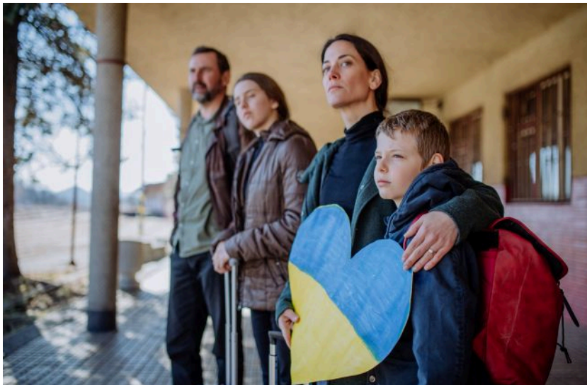
Фото: Українцям за кордоном спростили оформлення документа