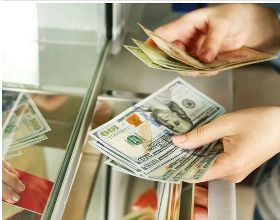
6,5 років за "сувенірний" обмін: у Києві засудили серійного шахрая, який викрав понад 3,5 мільйона гривень

На зміну валюті — «сувеніри»: київського серійного шахрая засуджено до 6,5 років ув'язнення.