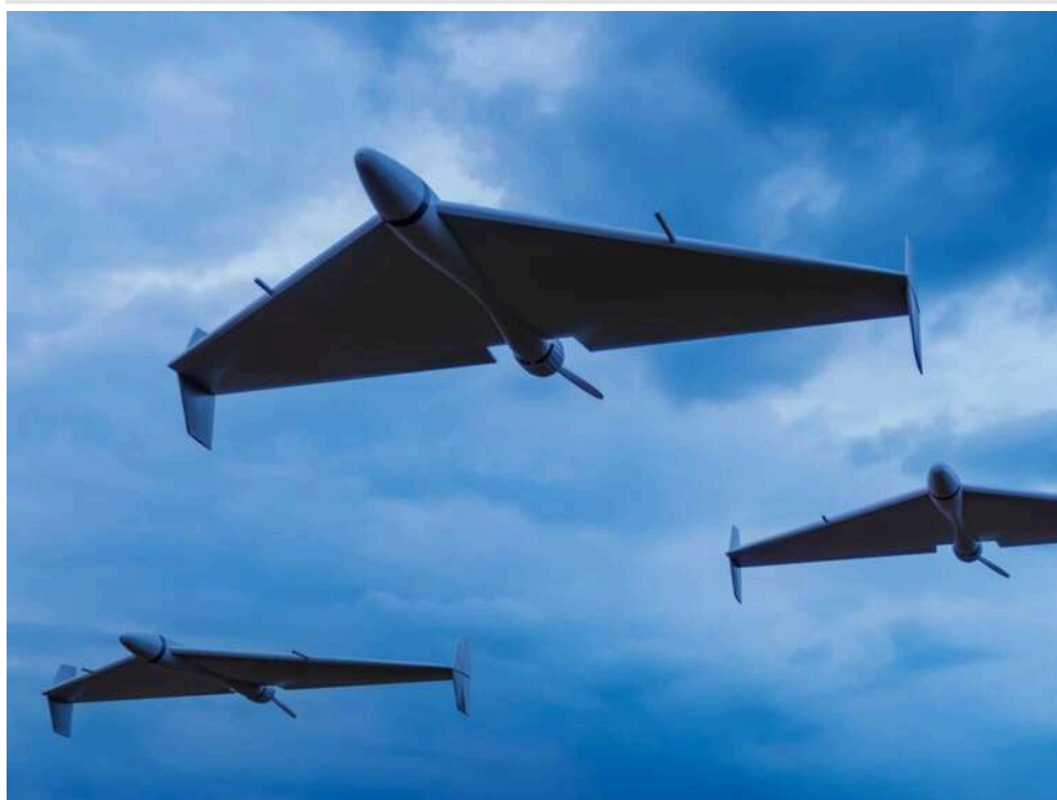
"Дрони-ракети" на швидкості 600 км/год: РФ готує масоване застосування реактивних "шахедів"

Росія готується до масового використання реактивних «шахедів»: їхня частка в атаках може сягнути 50%.