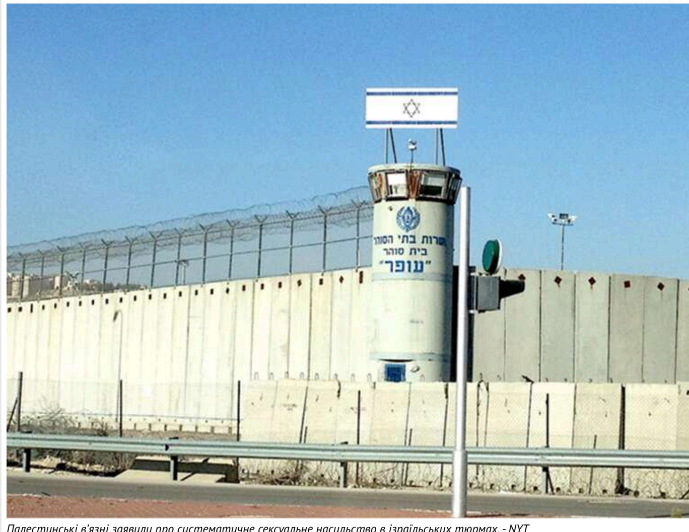
Палестинські в'язні заявили про систематичне сексуальне насильство в ізраїльських тюрмах, - NYT

Газета The New York Times звинуватила владу Ізраїлю в систематичному сексуальному насильстві над палестинськими ув'язненими. Зокрема, за твердженнями, для цього використовувалися службові собаки.