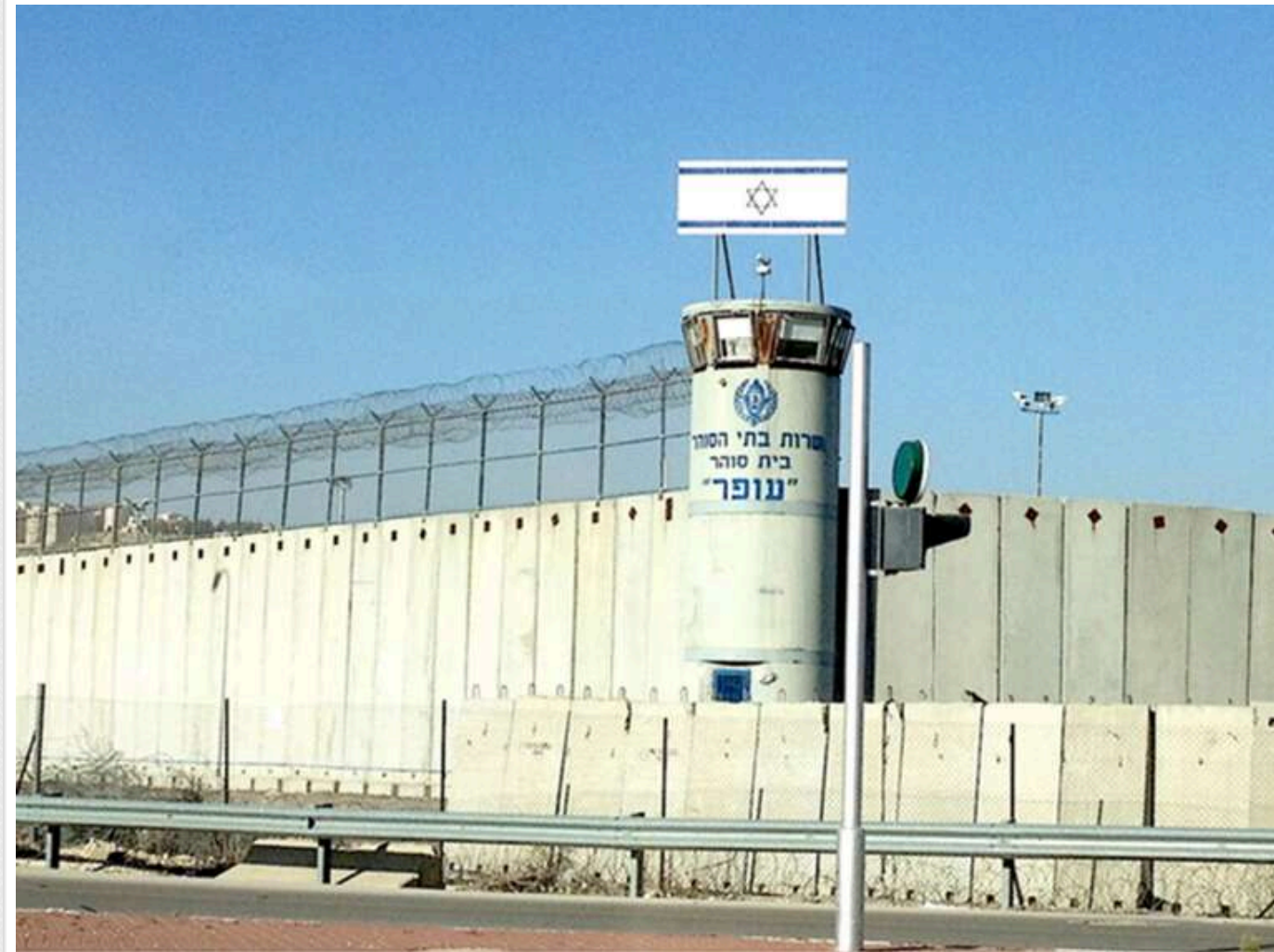
Палестинські в'язні заявили про систематичне сексуальне насильство в ізраїльських тюрмах, - NYT

Газета The New York Times звинуватила владу Ізраїлю в систематичному сексуальному насильстві над палестинськими ув'язненими. Зокрема, за твердженнями, для цього використовувалися службові собаки.