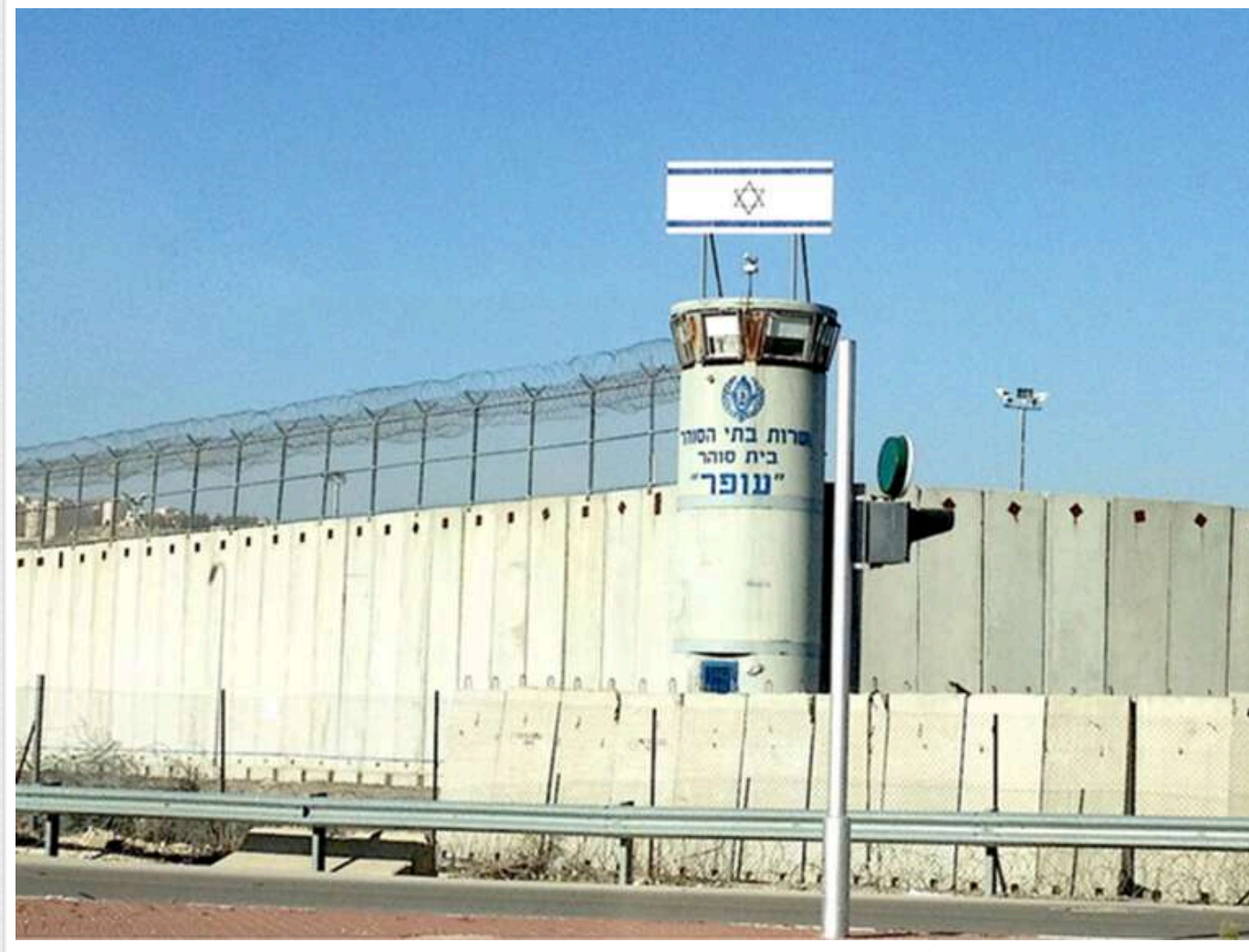
Палестинські в'язні заявили про систематичне сексуальне насильство в ізраїльських тюрмах, - NYT

Газета The New York Times звинуватила владу Ізраїлю в систематичному сексуальному насильстві над палестинськими ув'язненими. Зокрема, за твердженнями, для цього використовувалися службові собаки.