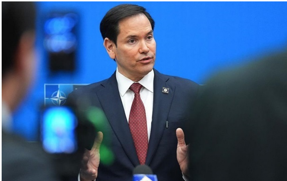
Марко Рубіо похвалив ЗСУ

Українці почуваються дедалі впевненіше щодо своєї позиції на полі бою, вважає Марко Рубіо.