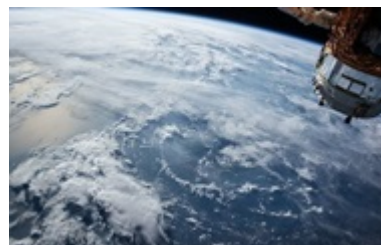
Україна почала запуск власних супутників - ЗМІ 15:17

"Якщо подивитися, що росіяни втрачають у п'ятеро більше солдатів на місяць, ніж українці, а Україна – менша країна і, власне, має меншу армію – хоча, щоб було зрозуміло, зараз українські збройні сили є найсильнішими та найпотужнішими збройними силами у всій Європі – очевидно, завдяки значній допомозі, яку вони отримали, а також завдяки бойовому досвіду, який вони набули", – заявив він.