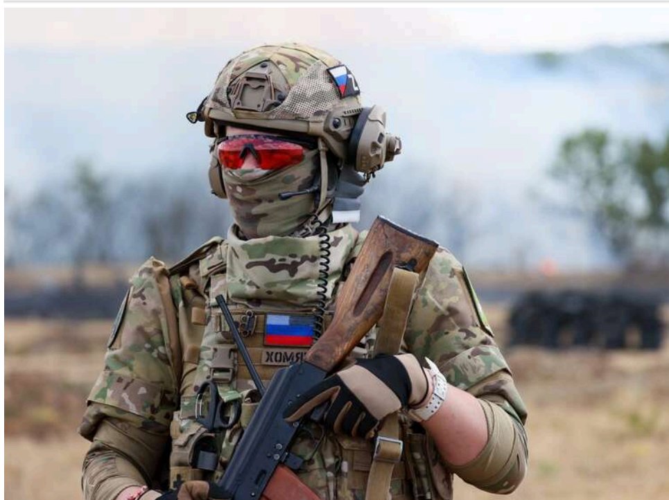
Друга Чорнобаївка на Запоріжжі: речник Сил оборони півдня пояснив, чому окупанти 1,5 року "беруть" Малу Токмачку

Російські війська понад півтора року намагаються просунутися поблизу Малої Токмачки на Запорізькому напрямку, але без жодного успіху.