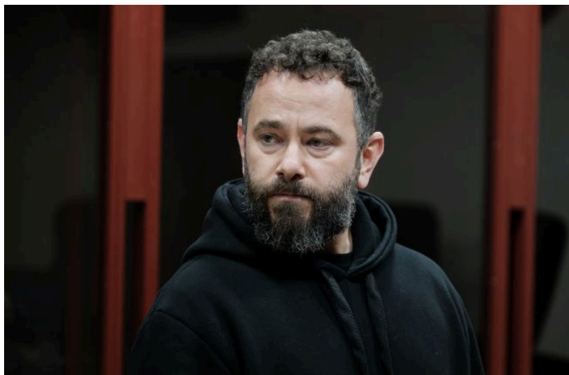
Фото: народний депутат Олександр Дубінський (Віталій Носач, РБК-Україна)