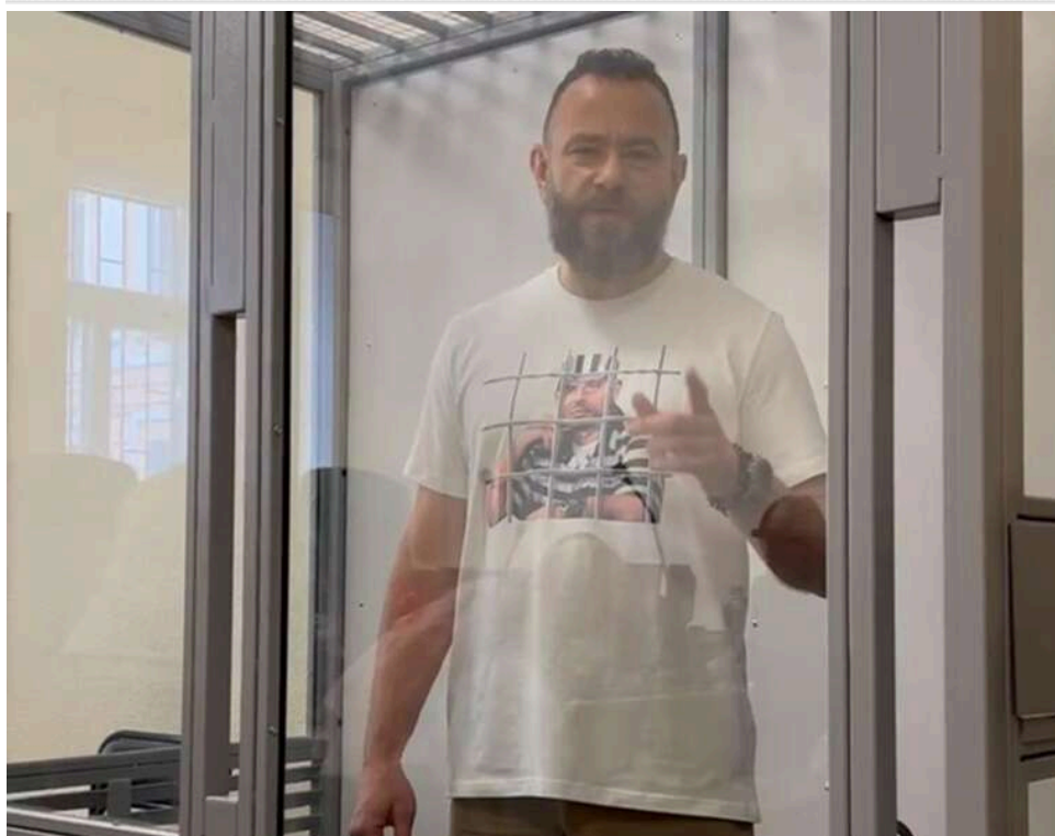
З СІЗО в Менську колонію: Дубінський заявляє про політичну розправу після рішення суду

Народний депутат Дубінський, який перебуває в СІЗО, повідомив, що суд вирішив перевести його до Менської виправної колонії №91 Чернігівської області, розцінивши дії влади як політичне переслідування.