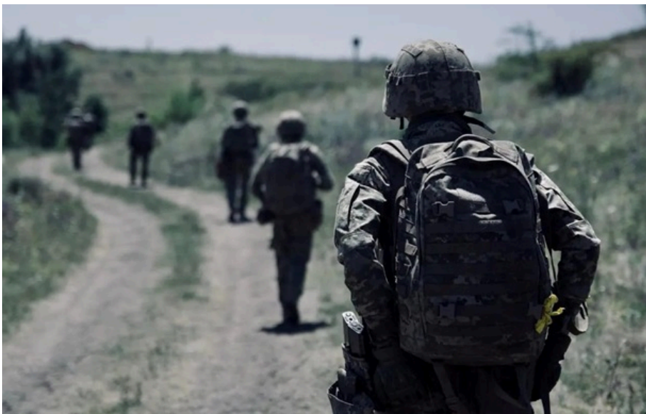
ЗСУ стримують атаки рашистів на 11 напрямках

Більше всього російських окупати атакують в районах Покровська. Наразі там тривають чотири боєзіткнення.