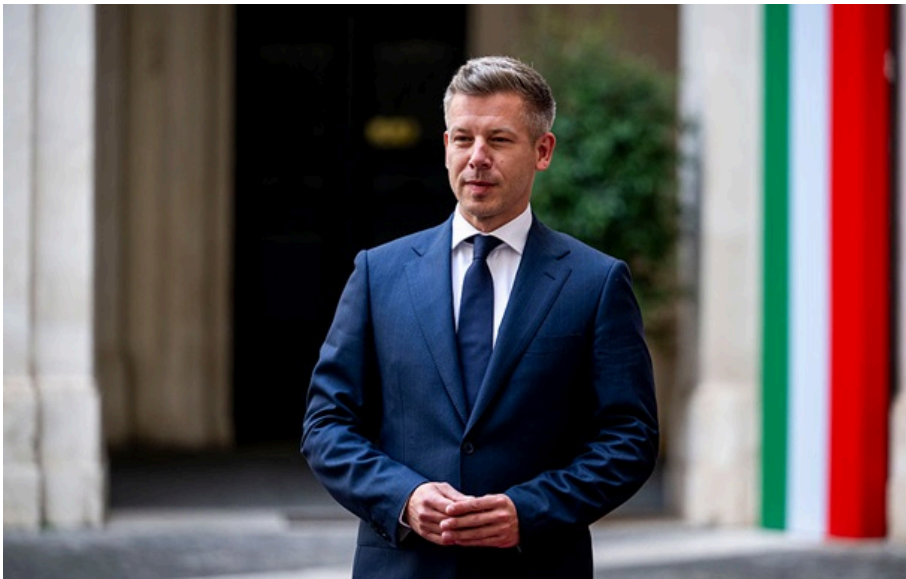
Петер Мадяр викликав російського посла

Напередодні Закарпатська область зазнала найбільшої атаки з початку повномасштабного вторгнення Росії. На це гостро відреагували "союзники" Росії.