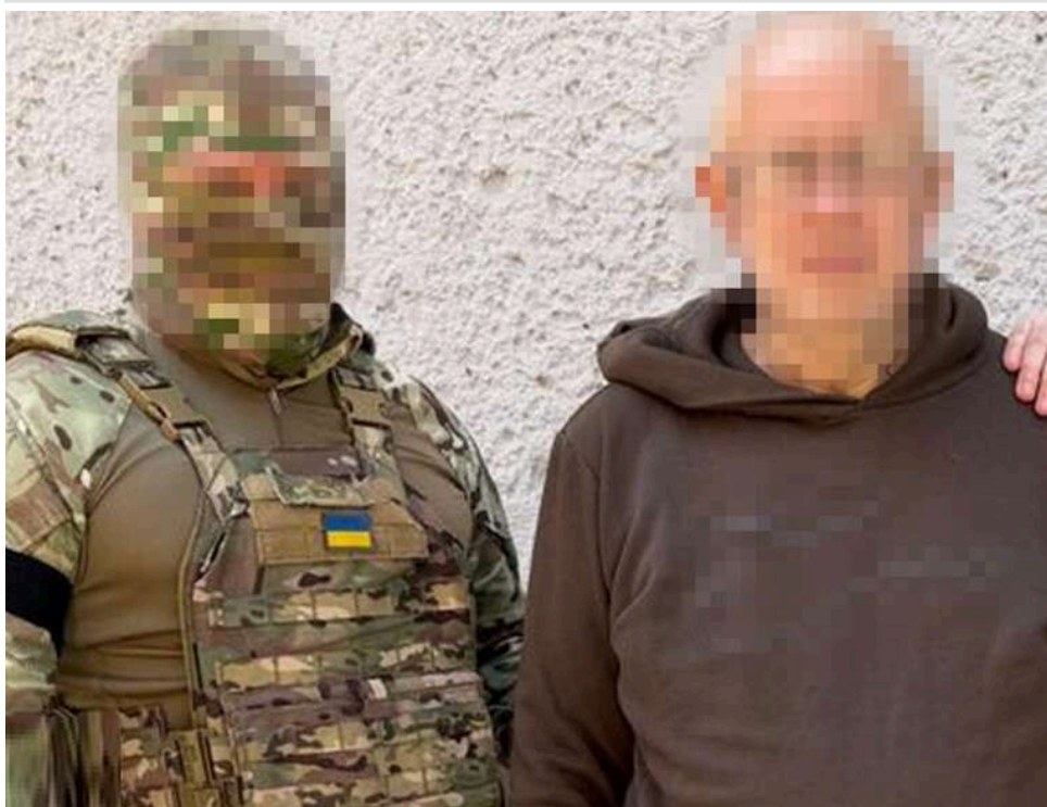
Їздив містом на таксі та фотографував позиції ЗСУ: на Харківщині викрили агента, який працював на ворога «втемну»

Контррозвідка Служби безпеки затримала на Харківщині ще одного агента ФСБ. Ним виявився завербований РФ місцевий житель – чоловік ворожої інформаторки, яку СБУ викрила у січні цього року на коригуванні повітряних ударів.